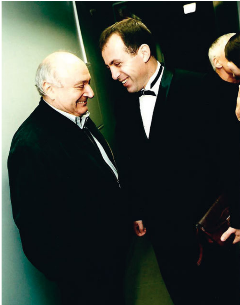
С Михаилом Жванецким