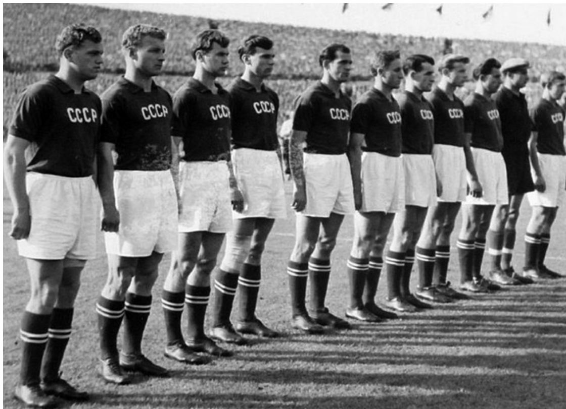
Сборная СССР в Ганновере (ФРГ) в 1956 году: Борис Татушин, Николай Тищенко, Анатолий Ильин, Валентин Иванов, Михаил Огоньков, Алексей Парамонов, Сергей Сальников, Эдуард Стрельцов, Анатолий Башашкин, Лев Яшин, Игорь Нетто.