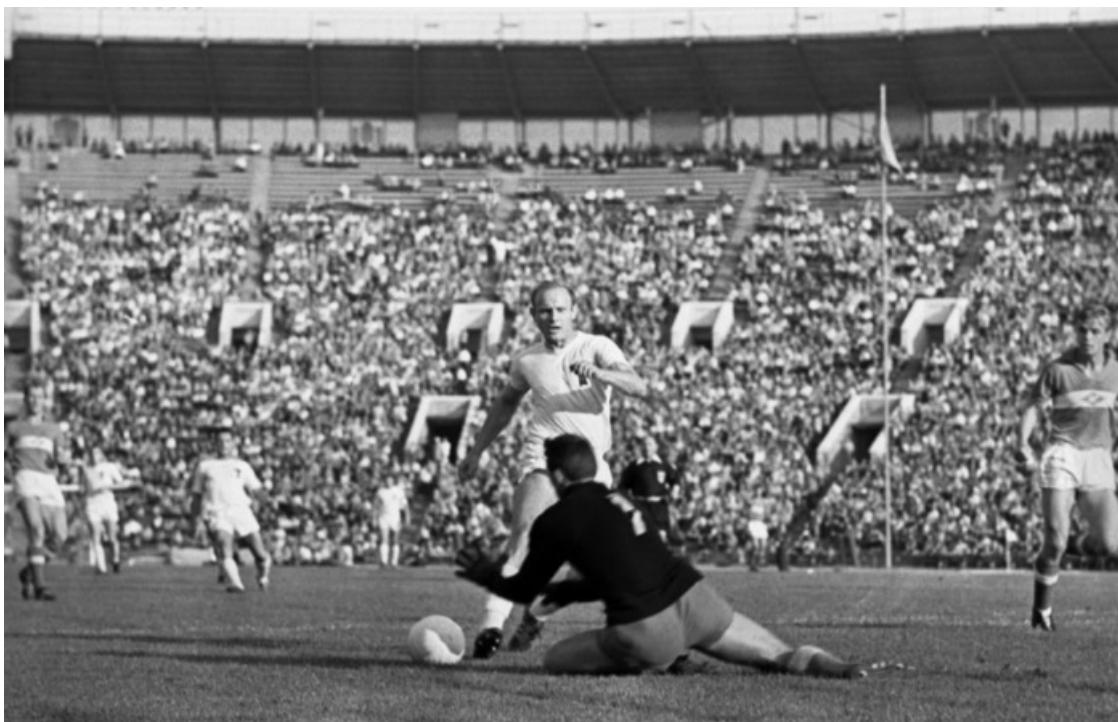
Чемпионат СССР по футболу 1966 года. Матч между «Торпедо» и «Спартак»