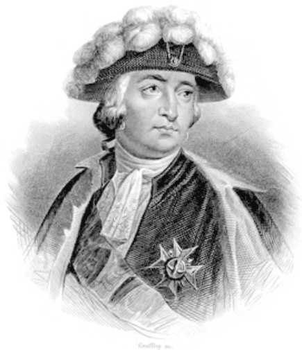
Герцог Орлеанский. Гравюра Ш.М. Жюфруа

сонских лож Франции. Кроме того, вокруг него всегда в поисках заработка крутились многочисленные журналисты и памфлетисты. Через масонские ложи и прессу он мог исподволь оказывать серьезное влияние на общественное мнение. Осенью 1788 года «Орлеанская клика», как недруги обычно называли его окружение, активно агитировала в пользу организации Генеральных штатов на новых принципах.