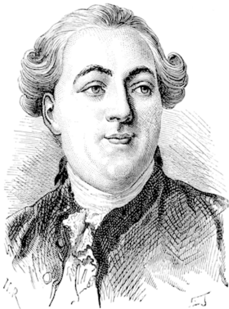
ЖАК НЕККЕР. Гравюра с портрета кисти Ж. Дюлессис

Эта новая оппозиция, отличная от прежней, аристократической, получила у современников название «патриотической партии». Ее неформальным координирующим центром стал так называемый Комитет тридцати, куда вошла целая плеяда ярких личностей, которые сыграют в Революции ведущие роли. «Герой Старого и Нового света», маркиз