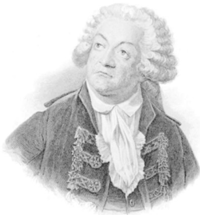
Граф де Мирабо. Гравюра с портрета кисти Ж. Бозе

жала треть мест. В третьем сословии, да и в населении Франции вообще, подавляющее большинство приходилось на долю крестьян. Однако их среди депутатов не было. Половину мест представителей третьего сословия занимали владельцы должностей в судебных и финансовых учреждениях и чуть больше четверти – близкие к ним по своему статусу и интересам лица свободных профессий, в основном адвокаты.