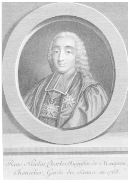
РЕНЕ НИКОЛЯ ДЕ МОПУ. Гравюра XVIII в.

Взошедший на трон внук покойного короля, 20-летний Людовик XVI не имел ни малейшего представления о том, как вести государственные дела, поскольку дед его к ним не допускал. Однако молодому королю очень хотелось заслужить любовь подданных, а потому, прослышав, что канцлера Мопу и его реформу очень ругают, он немедленно эту реформу отменил, а канцлера отправил в отставку. Тому ни-