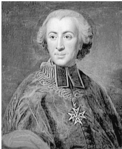
Этьен Шарль де Ломени де Бриенн. Портрет кисти Ж.Б. Дена

Ломени де Бриенну не оставалось ничего иного, как идти со своим реформаторским проектом в Парижский парламент. Тот, разумеется, отклонил закон о едином поземельном налоге, предполагавший ликвидацию фискальных привилегий первых двух сословий, и тоже посоветовал монарху созвать Генеральные штаты. Чтобы сломить сопротивление судейской аристократии, правительство назначило на 6 августа 1787 года заседание парламента с участием Людовика XVI. В присутствии короля, как мы знаем, любой акт подлежал регистрации без возражений. В ответ парламент принял постановление, которым заранее дезавуировал всякую