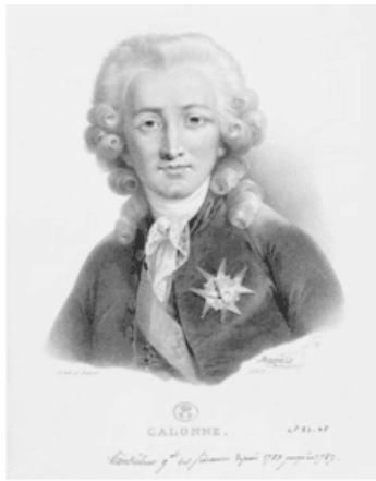
Шарль-Александр де Калонн. Эстамп с портрета кисти Э. Виже-Лебрён

Калонн предложил Людовику XVI ввести вместо двадцатины бессловный и бессрочный поземельный налог. Согласно его замыслу, со всех возделываемых земель, независимо от статуса их владельцев, следовало ежегодно взимать в пользу государства от 2 до 5 % урожая в натуральной форме: с более плодородных больше, с менее плодородных меньше. Чтобы подсластить эту пилюлю дворянам, их освобождали от подушного налога.