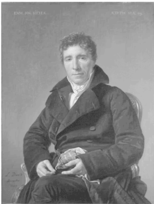
Эммануэль-Жозеф Сийес. Портрет кисти Ж.Л. Давида

Идея «аристократического заговора» витала над избирательными собраниями третьего сословия. Она служила универсальным объяснением для всего чего угодно: дороговизны («аристократы морят народ голодом»), выступлений крестьян и плебса против имущей части третьего же сословия («аристократы натравливают народ на патриотов»), нереша-