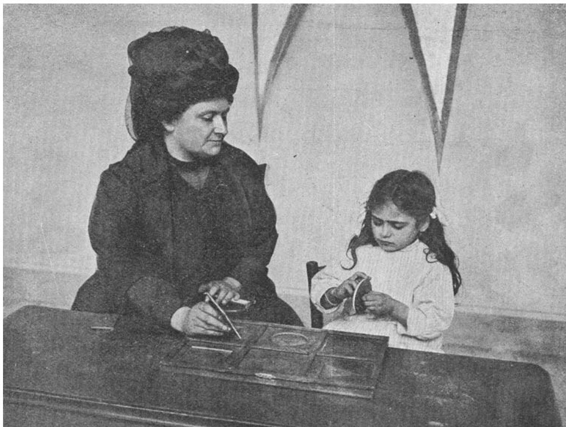
Мария Монтессори и мессинская сиротка

Они не могли понять того, что свобода не состоит в том, чтобы, собрав в одну комнату полсотни детей, предоставить их самим себе, а что свобода состоит в том, чтобы, изучивши душу каждого ребёнка отдельно, – следить за её деятельностью и уметь направлять её, никак ни в чём её не насилуя. Они не понимали того, что свобода не исключает повиновения учительнице, но требует того, чтобы это повиновение было сознательное и добровольное.