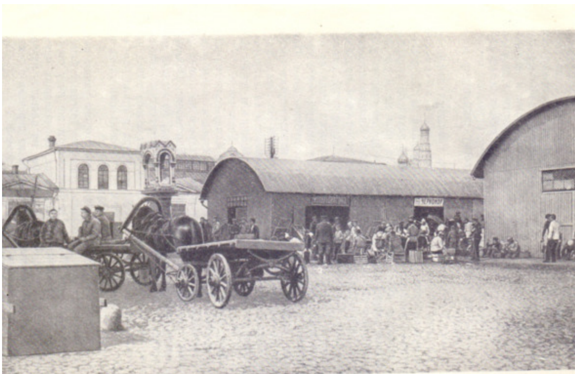
Болотная площадь в 1920-х годах (фото).

Происхождение и наречение в Садовом кольце древней московской фамилии родоначальников Болотиных поясняют обстоятельства, связанные с производством сукна. Обработка поставляемой с Дона сырьевой шерсти требовала расхода огромного количества воды. Следовательно, суконные «фабрики» должны были быть как можно ближе «привязаны» к Москве-реке.