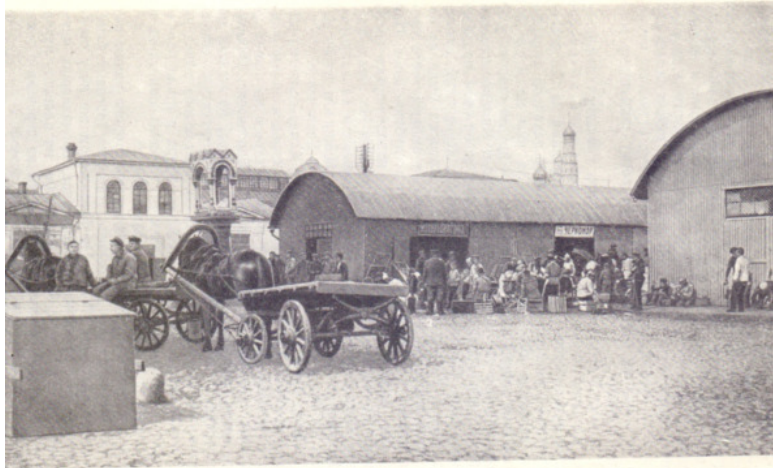
Болотная площадь в 1920-х годах (фото).