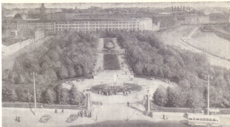
Сквер на Болотной площади со стороны улицы Серафимовича в 1957 г.