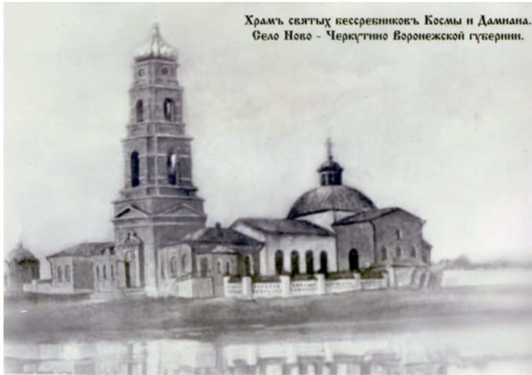
Храмъ святыхъ бессребрниковъ Космы и Дамнана. Село Ново - Черкутино Воронежской губернии.

Единственное двухэтажное здание школы до сих пор отражает особое попечение селян об образовании и воспитании детей. Немудрено, что многие из них, вырастая, потом легко определялись в городах Тамбове, Воронеже и даже в Москве.