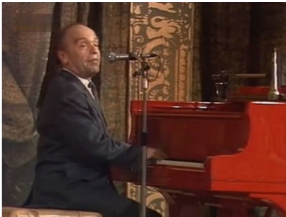
Композитор Владимир Шаинский

С тех пор, как мы в родительском краю, картавя, с младшим братом и сестренкой разучивали «Песню Мамонтенка», а позже в бравом воинском строю маршировали под «Не плачь девчонка», я сколько помню сам себя, пою! Всю жизнь мелодии расшили нитью тонкой.