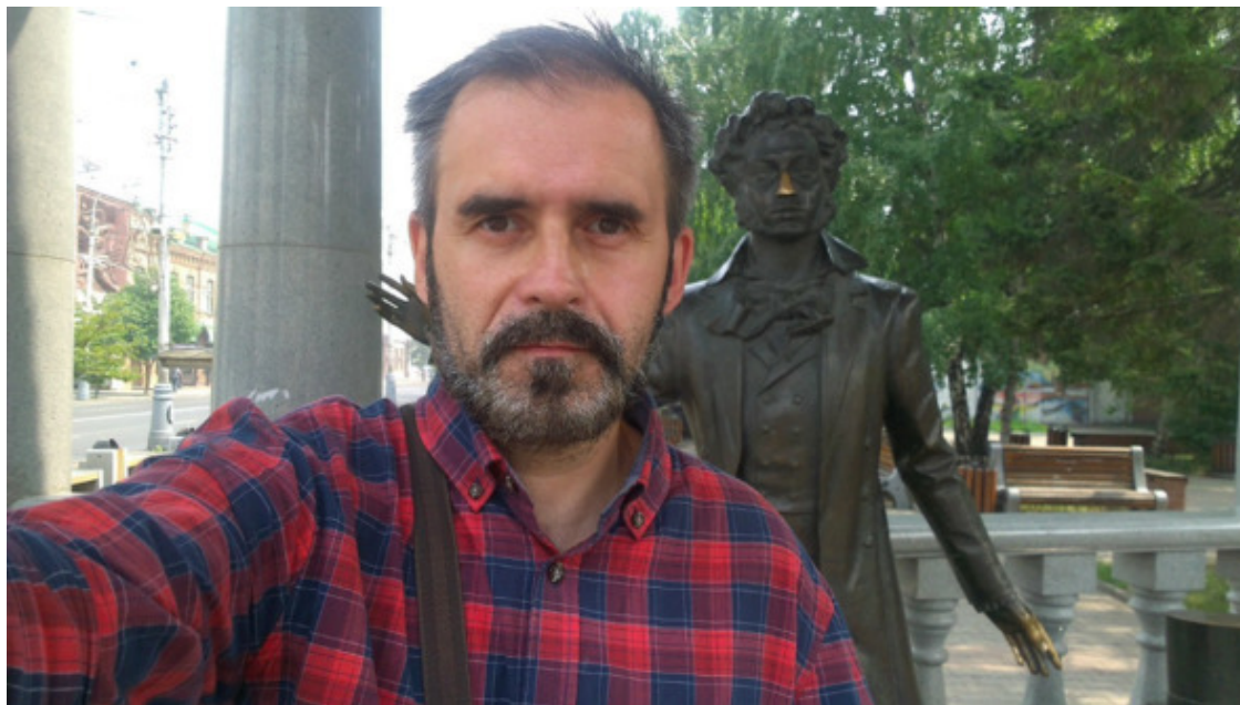
пр. Мира – Красноярск

Как приятно, когда кто-нибудь из друзей поэтов выразит своё правдивое мнение о творчестве товарища по цеху, прольёт капли чувств и возможно слёз под воздействием разрезанной луковицы стихов. Мне одинаково приятно, когда бы из-за моих стихов рыдали или бросали в меня камни, потому что молчаливое равнодушие страшнее простого расстрела поэта.