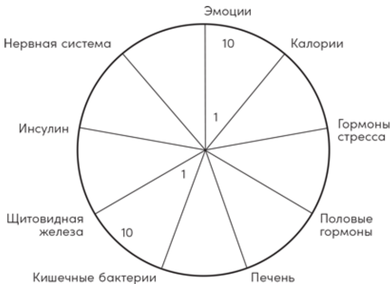
Рис. 1. Ваша диаграмма Случайного лишнего веса

Настало время совершенно по-новому посмотреть на еду,