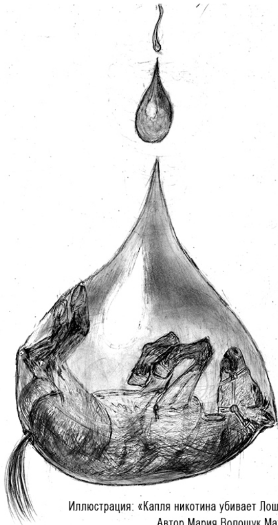
Иллюстрация: «Капля никотина убивает Лошадь» Автор Мария Волощук Махоса