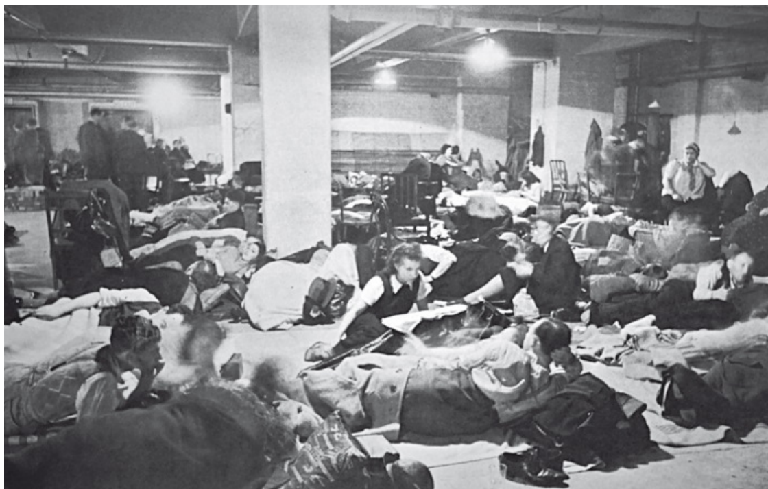
Жители Лондона в бомбоубежище в подвале магазина на Риджент-стрит во время бомбардировки города немецкой авиацией