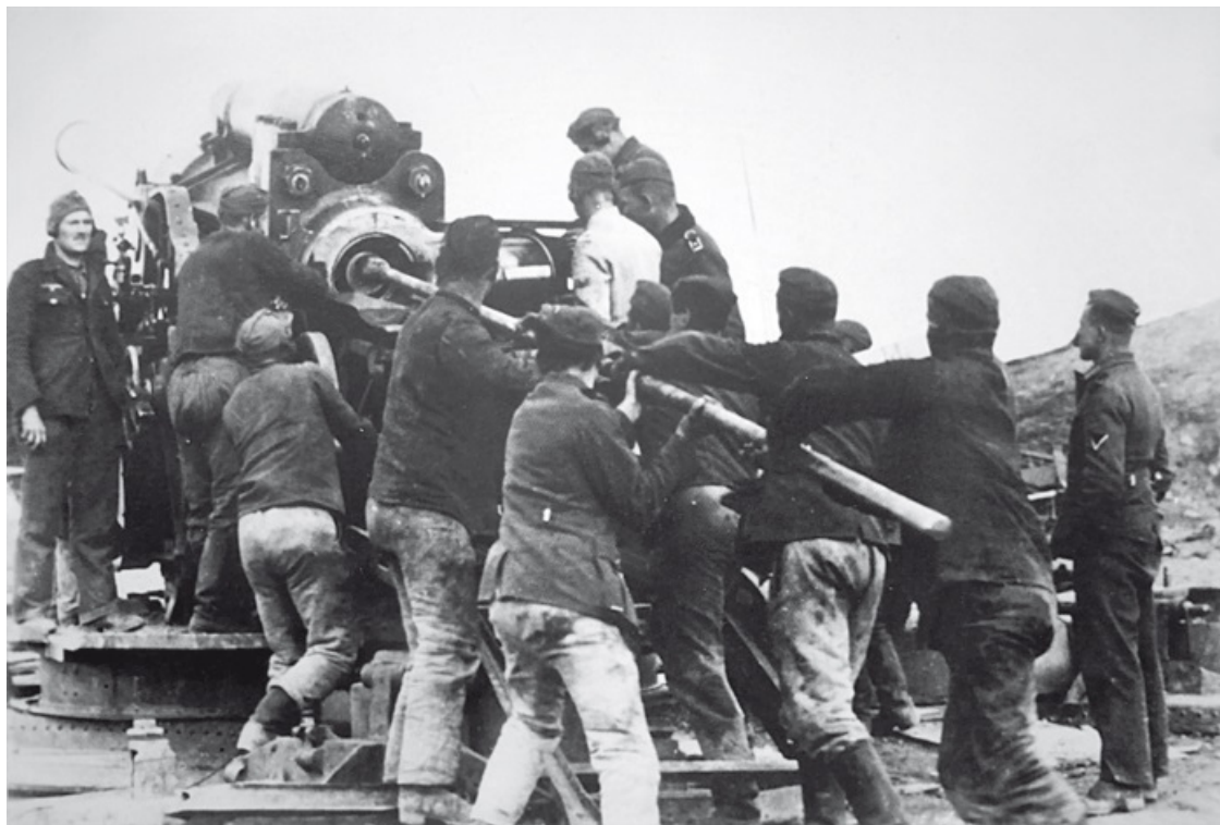
Немецкие артиллеристы заряжают 240-мм гаубицу на позиции под Ленинградом

Войскам, осаждавшим Ленинград, было приказано выделить подвижные силы и часть поддерживающей авиации для усиления возобновившегося наступления на Москву. Танковая группа, которая была отправлена на юг, к Рундштедту, теперь вернулась обратно для участия в наступлении. В конце сентября все снова было подготовлено для отмененного ранее удара в центре, между тем как южные армии продолжали наступать в восточном направлении, к нижнему течению Дона, откуда для них должна была открыться дорога на Кавказ.