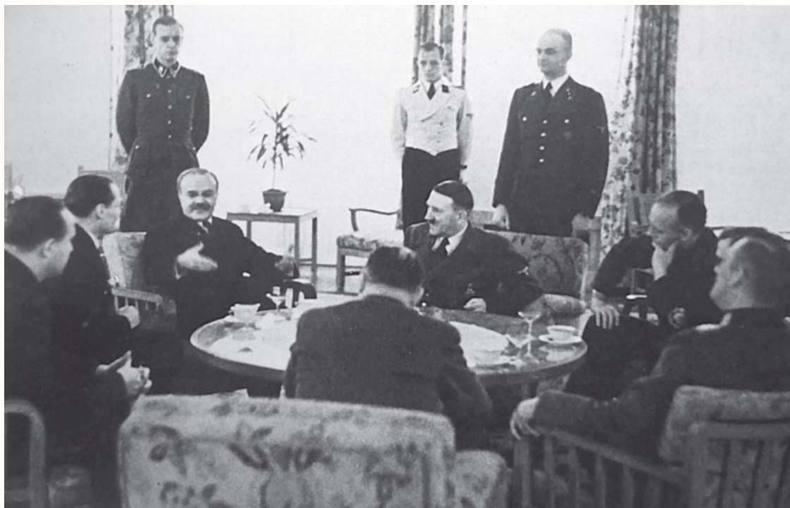
Председатель СНК СССР и Народный комиссар иностранных дел СССР В.М. Молотов на переговорах с А. Гитлером в Имперской канцелярии

В заключение фюрер заявил, что данное обсуждение в известной мере представляет собой первый конкретный шаг к широкому сотрудничеству с должным учетом проблем Западной Европы, которые должны решаться между Германией, Италией и Францией, а также проблем Востока, которые в первую очередь интересуют Россию и Японию, но в решениях которых Германия предлагает свои услуги в качестве посредника. Речь идет о сопротивлении всяким попыткам со стороны Америки «делать деньги за счет Европы». Соединенным Штатам нечего делать в Европе, Африке или Азии.