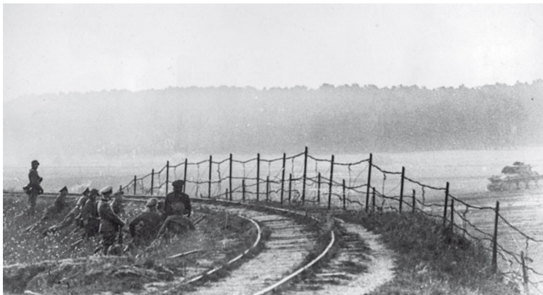
Танки вермахта пересекают границу Рейха и СССР в начале немецкого вторжения

Когда я проснулся утром 22 июня, мне сообщили о вторжении Гитлера в Россию. Уверенность стала фактом. У меня не было ни тени сомнения, в чем заключаются наш долг и наша политика. Не сомневался я и в том, что именно мне следует сказать. Оставалось лишь составить заявление. Я попросил немедленно известить, что в 9 часов вечера я выступлю по радио. В этот момент ко мне в спальню вошел с подробными известиями генерал Дилл, поспешивший ко мне из Лондона. Немцы вторглись в Россию на широчайшем фронте, застигли на аэродромах врасплох значительную часть советской авиации и, по-видимому, двигались вперед с огромной быстротой и стремительностью. Начальник имперского генерального штаба добавил: «Я полагаю, что они огромными массами будут попадать в окружение».