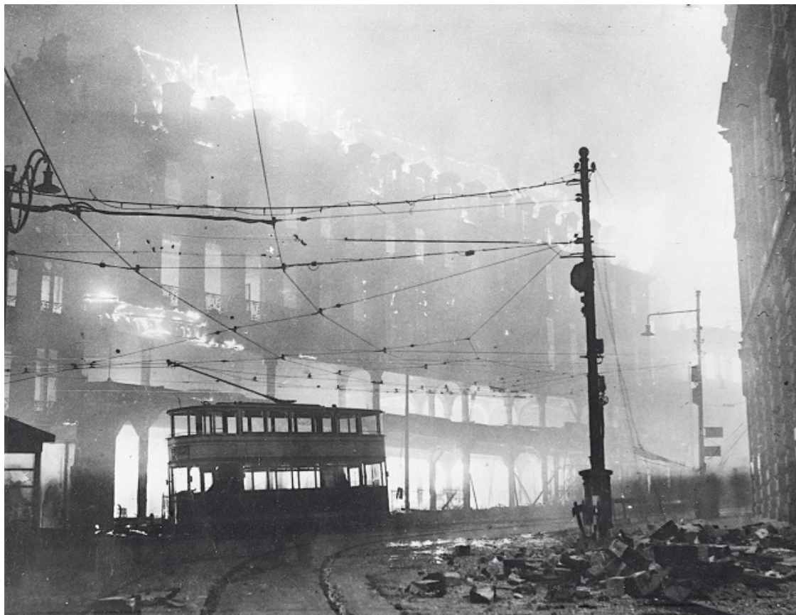
Горящее здание английского города Шеффилд после налета немецкой авиации

Я надеюсь, что вам удалось немного передохнуть на рождество от вашей напряженной работы. Я так восхищаюсь всем, что вы сделали за последние семь месяцев в качестве моего премьер-министра, и я получал столь большое удовольствие от наших бесед во время еженедельных завтраков. Я надеюсь, что они будут продолжаться по моему возвращении, и с удовольствием ожидаю их.