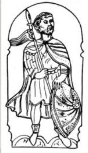
поздний воображаемый портрет