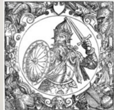
Гроторо с изображением Миндовга из «Описания Европейской Сарматии» Александра Гваньони

6 ИЮЛЯ - ДЕНЬ КОРОНАЦИИ МИНДАУГАСА. РОЖДЕНИЕ ЛИТОВСКОГО ГОСУДАРСТВА