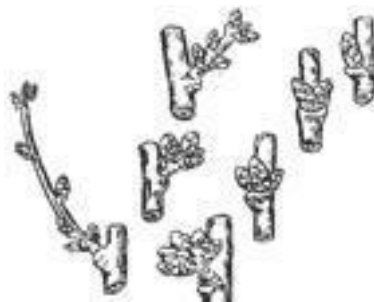
Рис. 1. Плодовые образования

У вишни цветковые почки простые, листовые части у них отсутствуют или находятся в зачаточном состоянии и поэтому из них развиваются только цветки. У некоторых сортов вишни встречаются смешанные почки, которые содержат зачатки цветков и побегов и чаще проявляются у молодых деревьев. Формируются цветковые почки на приростах текущего года и букетных веточках (рис. 1).