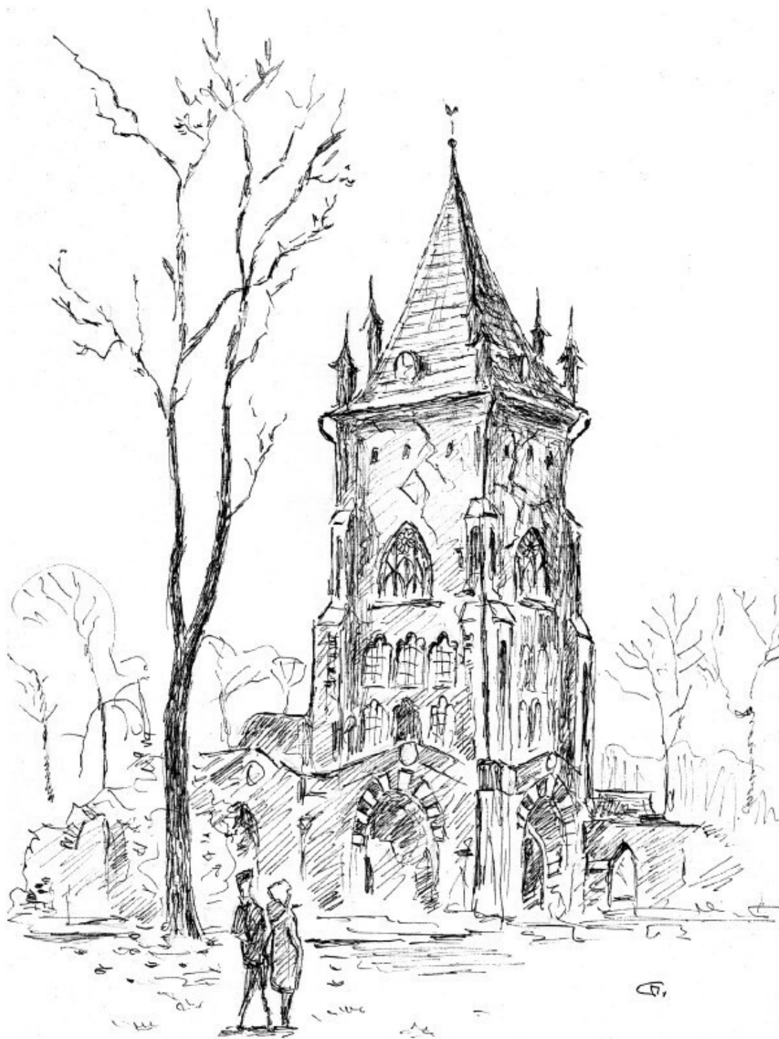
Шапель (капелла) – павильон в Александровском парке Царского Села