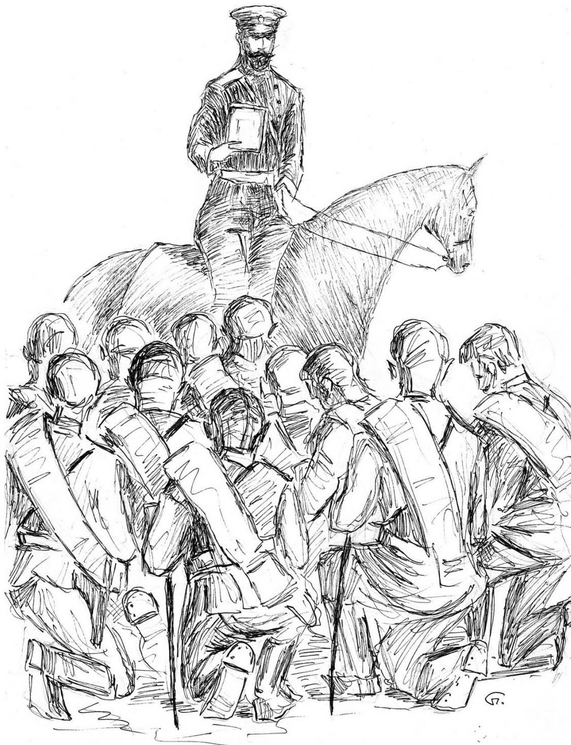
Русское воинство. Благословение