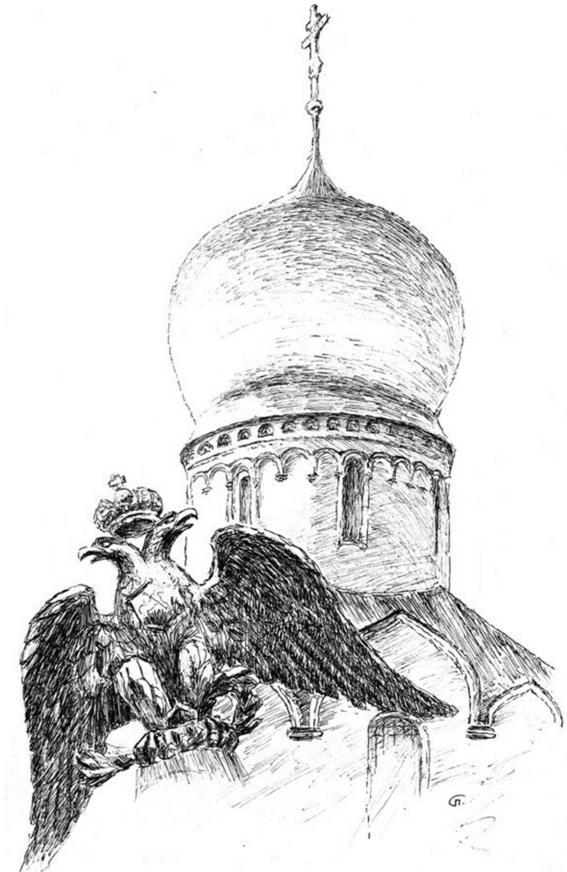
Фёдоровский Государев собор в Царском Селе