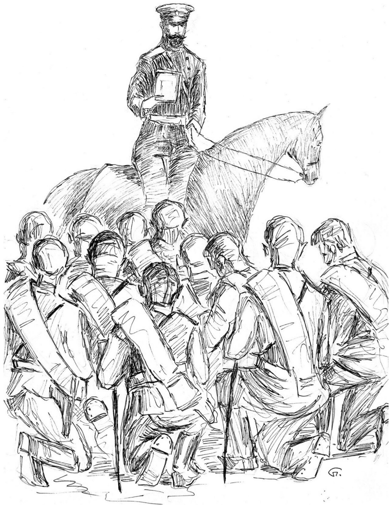
Русское воинство. Благословение