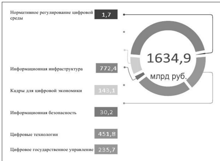
Рис. 2. Бюджет национального проекта «Цифровая экономика» 7

В рамках реализации данного национального проекта предполагается новый этап институциональных реформ в сфере государственного управления для формирования и развития «цифрового правительства» со следующими основными принципами и элементами его «архитектуры».