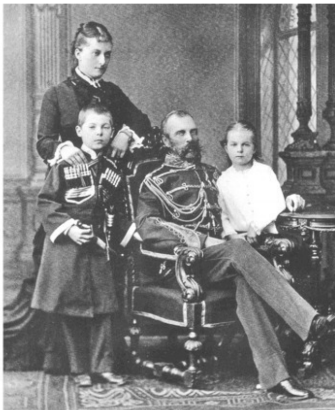
Екатерина Долгорукая и Александр II с детьми

«...к счастью, несмотря на то, что убийца стрелял в упор, Граф ранен, но разорвана шинель и мундир и легкая контузия. Слава Богу, что уцелел этот человек, который так нужен теперь бедной России!