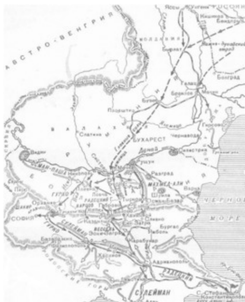
Схема военных действий на Балканах

24 ноября 1873 г. Русскому историческому обществу, которому Его Императорское Высочество изволил быть председателем с 1867 г., будет присвоено наименование «Императорского».