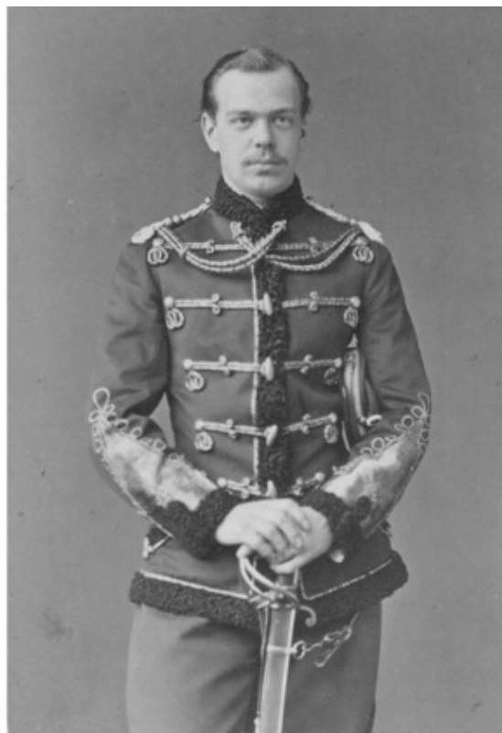
Великий князь Александр Александрович. Петербург. Середина 1860-х