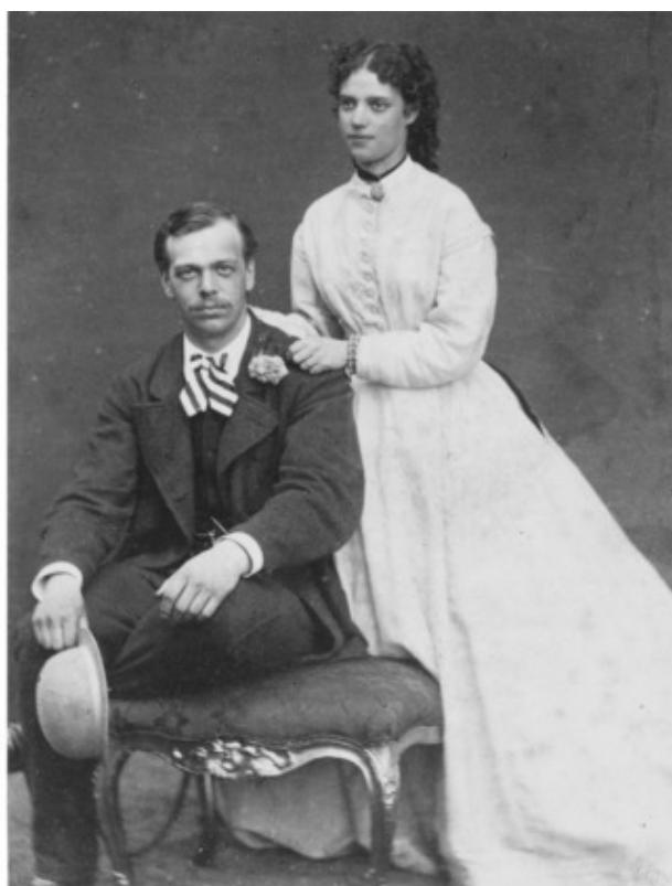
Цесаревич Александр Александрович и датская принцесса Дагмар

Начинаются его усиленные занятия с историками, правоведами, экономистами.