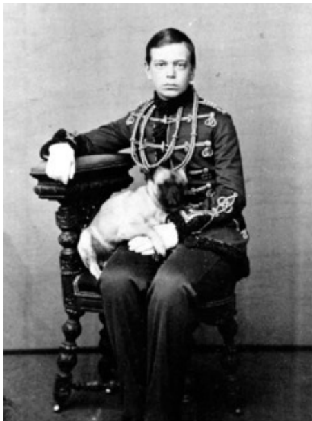
Великий князь Александр Александрович