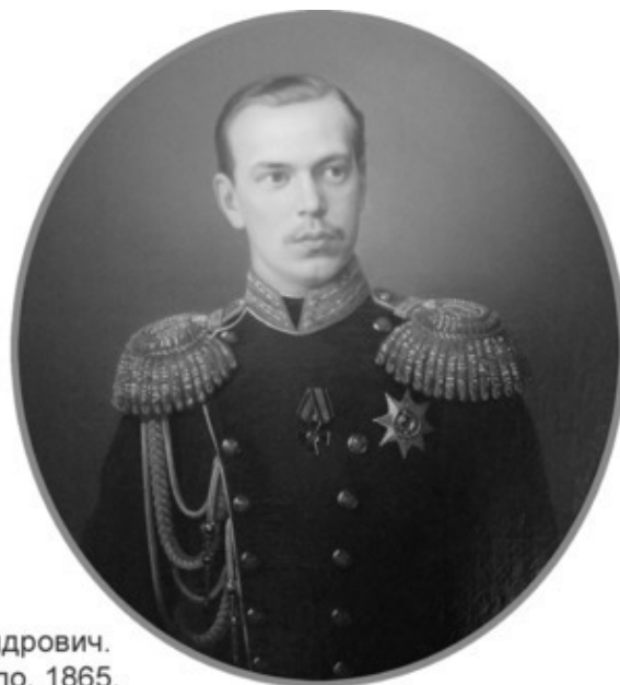
Цесаревич Александр Александрович. Иван Тюрин. Холст, масло. 1865.

Великий князь Александр Александрович – внук Николая I, сын Александра II и отец Николая II – родился 26 февраля 1845 г.