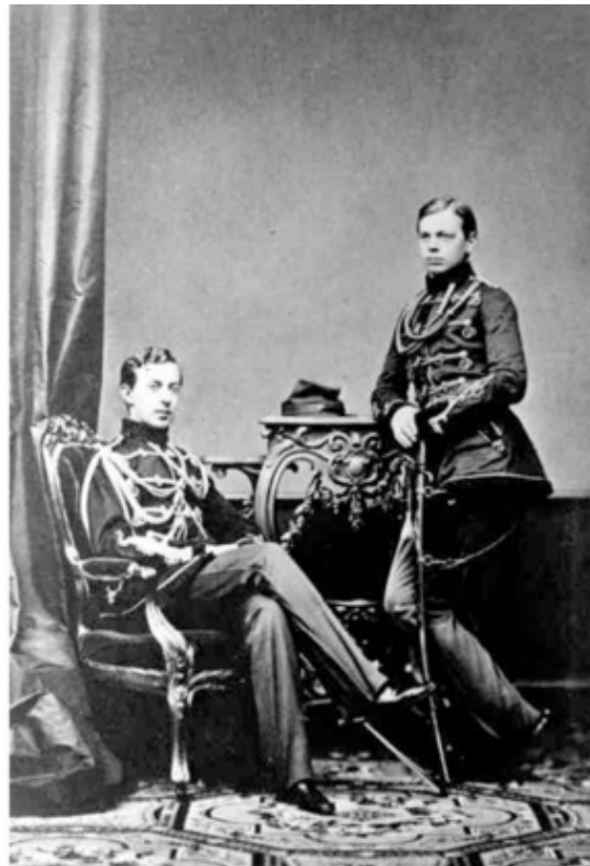
Великие князья Николай и Александр Александровичи

Николай Александрович скончается в ночь на 13 апреля 1865 г.