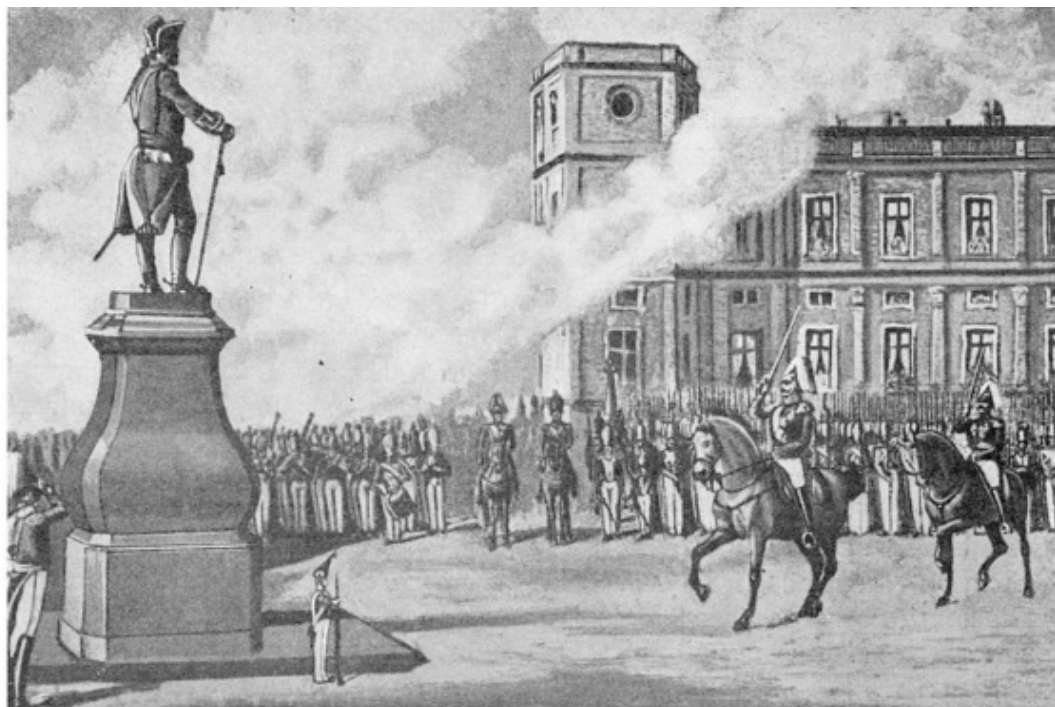
Открытие памятника Павлу I в Гатчине 1 августа 1851 г.

Братья делились друг с другом самыми сокровенными секретами, особенно, когда пришла пора их первых любовных переживаний.