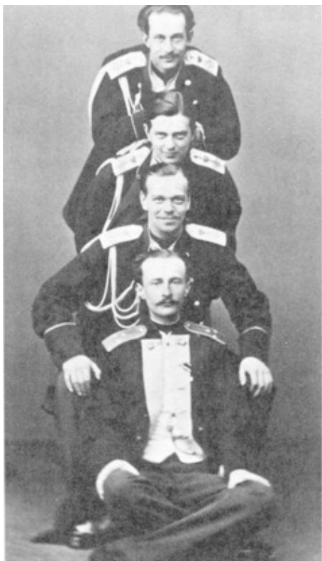
Сверху вниз: герцог Николай Максимилианович Лейхтенбергский, великий князь Владимир Александрович, цесаревич Александр Александрович и герцог Альберт Саксен-Альтенбургский. Середина 1860-х

Его первая должность – председатель Особого комитета по сбору и распределению пособий голодающим из-за неурожая в ряде губерний.