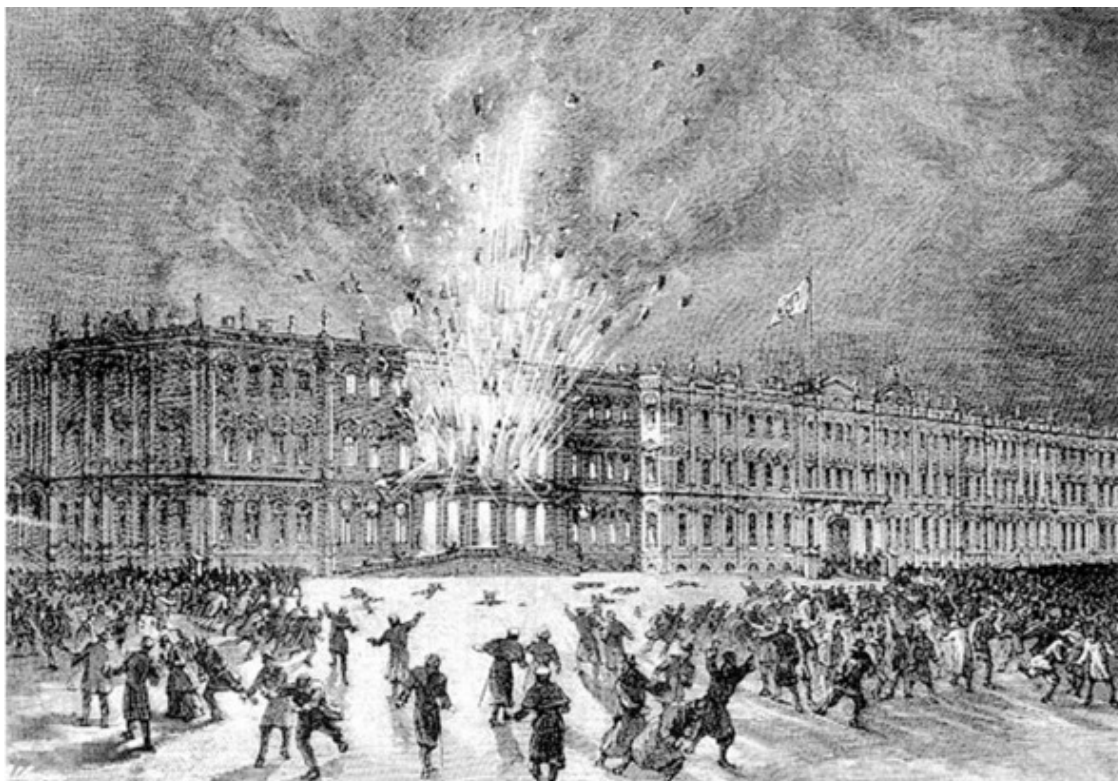
Взрыв в Зимнем дворце

На 5 февраля 1880 г. был намечен большой приём с участием всех представителей царской фамилии. Цесаревич, встретив своего дядю Александра Гессенского, приехавшего вместе с сыном, князем Болгарии, провёл их в покои императрицы. Она не хотела отпускать брата и племянника слишком скоро, и встреча затянулась. Когда они, наконец, направились в столовую, к ним присоединился император.