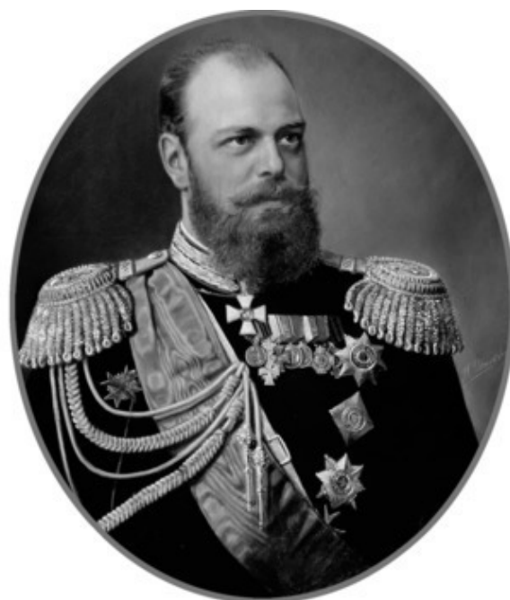
Шильдер Н.Г. Портрет императора Александра III. Конец XIX в.

Создано в интеллектуальной издательской системе Ridero