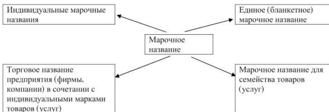
Рис. 2. Основные подходы к присвоению марочного названия.

На рис.2 представлены основные подходы присвоения марочного названия. Товарный знак (знак обслуживания) может быть зарегистрирован на имя юридического лица, а также физического лица, осуществляющего предпринимательскую деятельность. На зарегистрированный товарный знак (знак обслуживания) выдается свидетельство, которое удостоверяет приоритет товарного знака, исключительное право владельца на товарный знак в отношении товаров, указанных в свидетельстве.