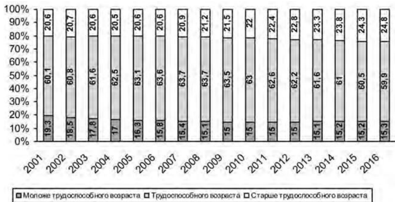
Рис. 1.1. Прогноз численности населения по основным возрастным группам (на начало года, в % к общей численности населения)

жизни, уровень здоровья пожилых россиян будут ниже средней продолжительности жизни и уровня здоровья жителей экономически развитых стран 4 .