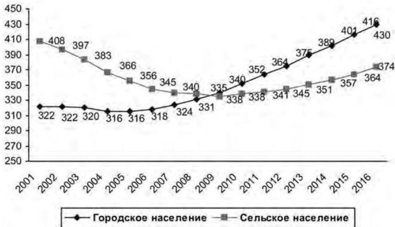
Рис. 1.2. Демографическая нагрузка, прогноз (на 1000 лиц трудоспособного возраста приходится лиц старше трудоспособного возраста, на начало года)