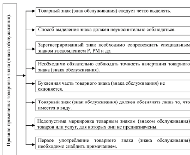
Рис. 1. Принципы и условия применения товарного знака (знака обслуживания)

При регистрации, использовании или передаче товарного знака пользуются многочисленными документами, основным из которых является Конвенция по охране промышленной собственности (статья 6):