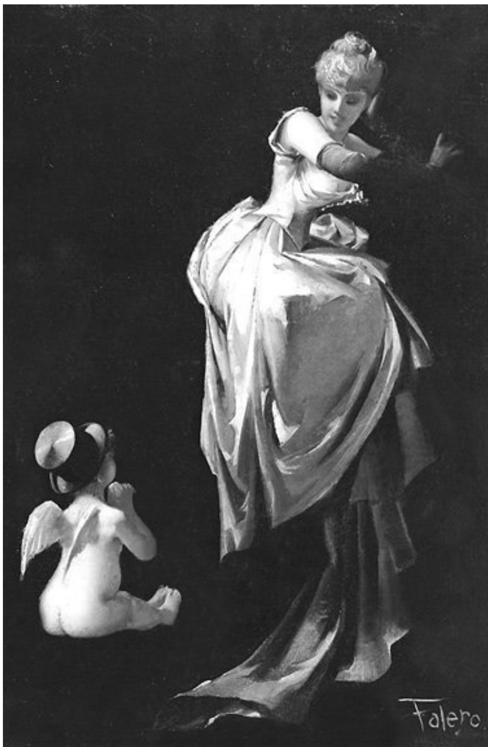
Ангел и ведьма. С картины Л.Р. Фалеро

Обычно белая ведьма использует такие традиционные методы, как заговоры, снадобья из трав, талисманы и амулеты и иные хорошо известные приемы и средства.