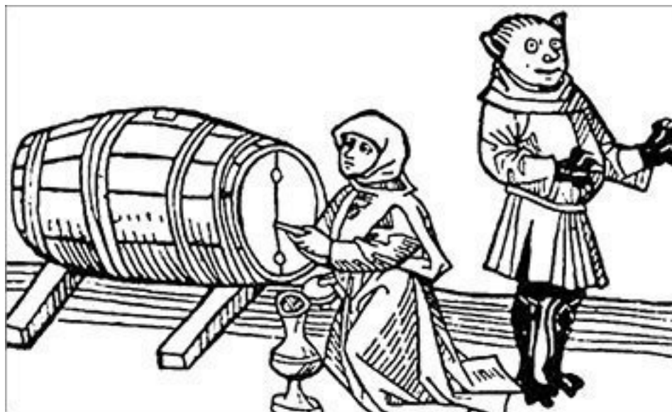
Колдунья, ворующая вино из закрытого погреба с помощью демона. Гравюра 1486 г.

Кроме урожая, ведьмы могут скрадывать и другие припасы, которые необходимы для благосостояния человека. Например, они могут уносить мед из ульев, загонять к себе рыбу и забирать птиц и зверей, за которыми ходят на промысел охотники.