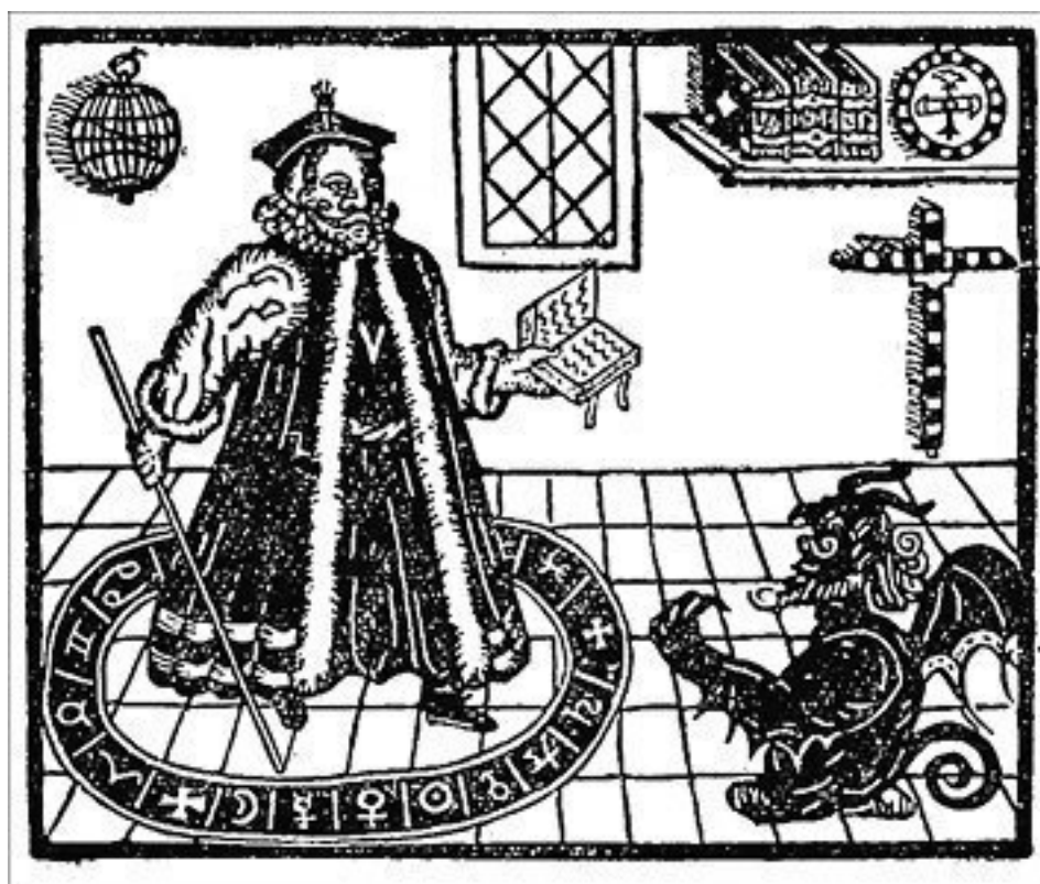
Доктор Фауст призывает нечистого. Гравюра начала XVII в.

Кстати, западноевропейские инквизиторы имели обыкновение длинной острой иглой протыкать на теле потенциальной ведьмы все темные родинки и бородавки. При этом, если женщина кричала от боли, то это являлось доказательством того, что она ведьма, поскольку считали, что от боли кричит не она, а вселившиеся в нее демоны.