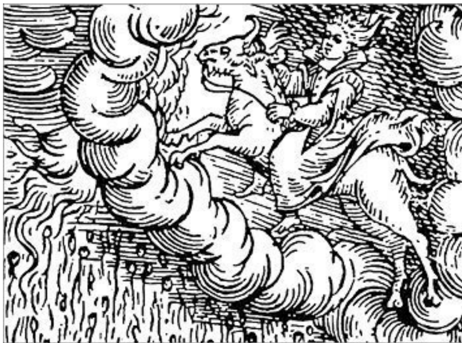
Девушка, насылающая бурю и градобитие.

Иллюстрация к трактату о колдовстве Ф.-М. Гваццо, 1626 г.