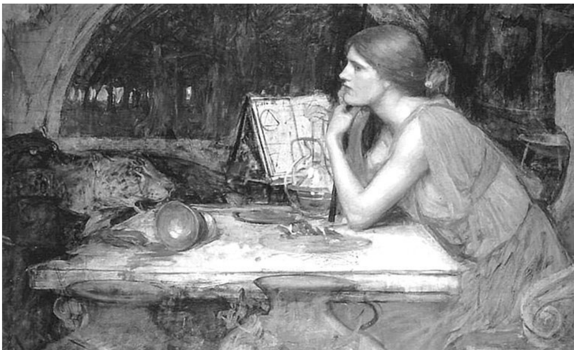
Волибница. С картины Дж. Уотерхауса

Важно то, что славянские ведьмы, в отличие от западноевропейских ведьм, знали все колдовские обряды, различные заклинания, шептания, заговоры, сглазы, порчи или их снятие. Отметим, что западноевропейские ведьмы могли знать только одно или два вредоносных заклинания, в зависимости от их узкой специализации, хотя соитие с демонами или самим дьяволом, а также продажа ему своей души считалось обязательным их действием.