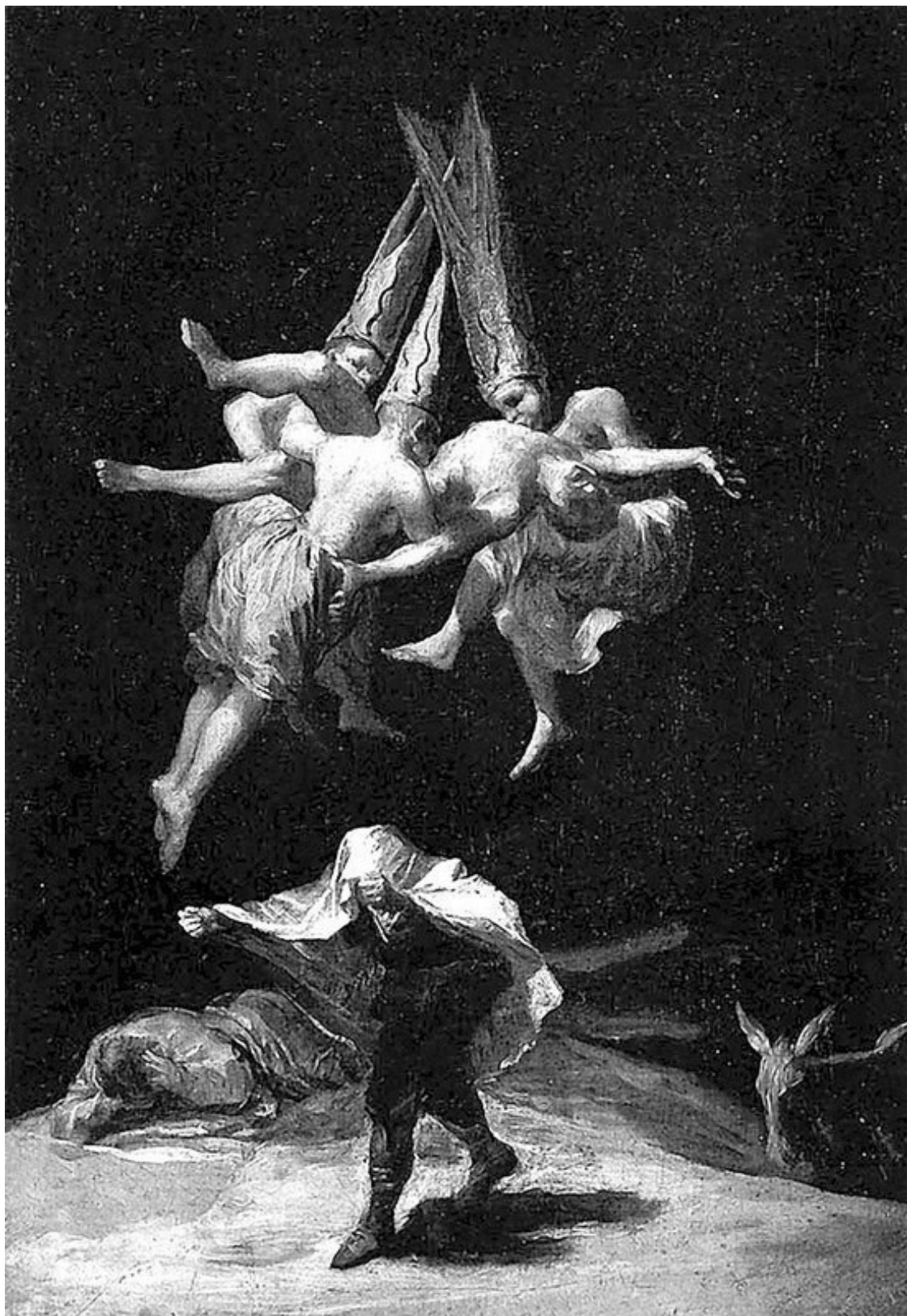
Полет ведьм. С картины Ф. Гойя

4. Все ведьмы – оборотни, хотя превратиться они могут только в символы темных сил, ворон, сорок, сов, черных кошек, волчиц, а иногда в собак или лисиц и т. д.