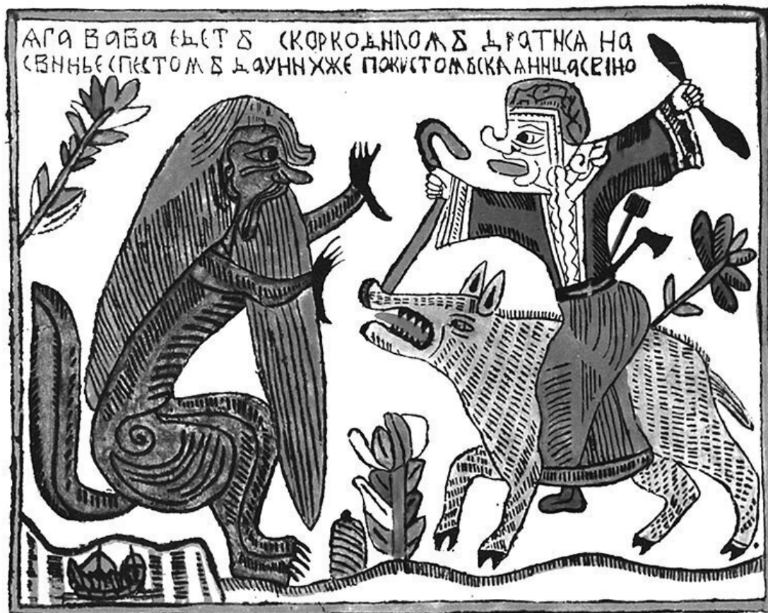
«Яга-баба едет с коркодилем драться». Русский народный лубок