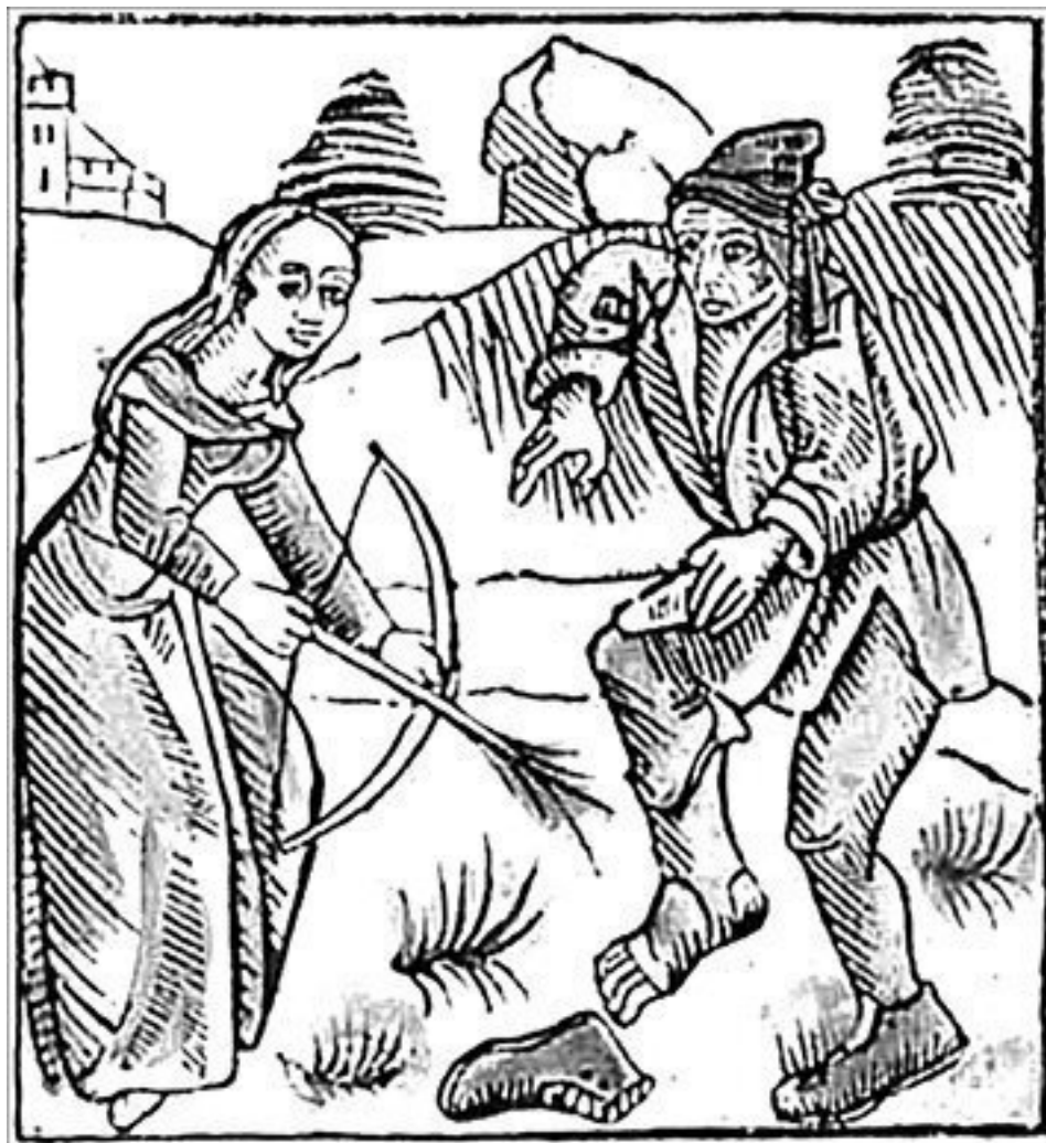
Девушка, насылающая болезнь. Гравюра 1489 г.

Несчастный, которым овладевала болезнь, наведенная колдовством, приносил ее с собою везде, куда бы ни пришел. Такая неотвязная и неизлечимая болезнь выразилась в поверье, что злобные духи, такие как мары, поселяются внутри больного и делают его бесноватым или разъезжают на его спине. Они налегают на человека страшною тяжестью и заставляют его возить себя, изнуряют, ломают и трясут его тело. Такое же представление связано и с самими ведьмами, которые в ночные часы могут явиться в избы, сесть на сонных людей, давить их и принуждать носить себя по окрестностям.