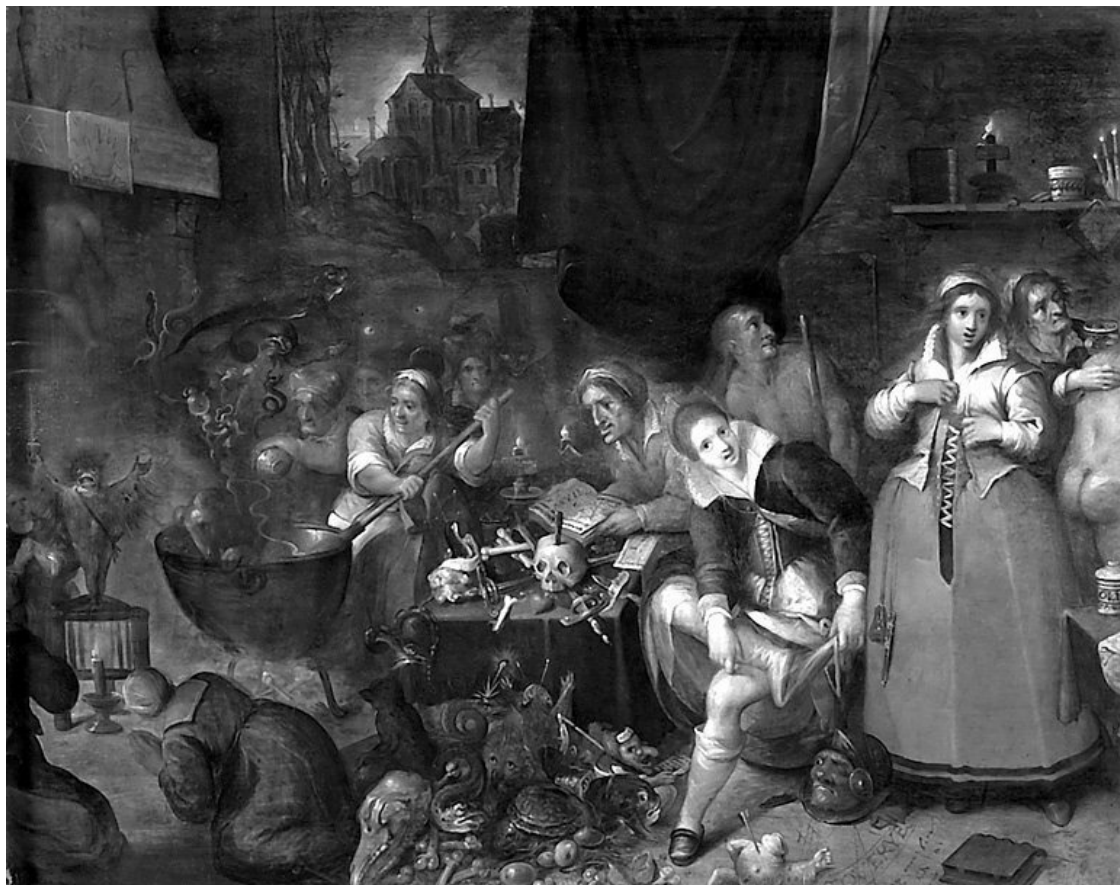
Младший шабаш ведьм. С картины Ф. Франкена-младшего

В ряде случаев ведьм представляли в образе страшных старух, а иногда они виделись юными красавицами.