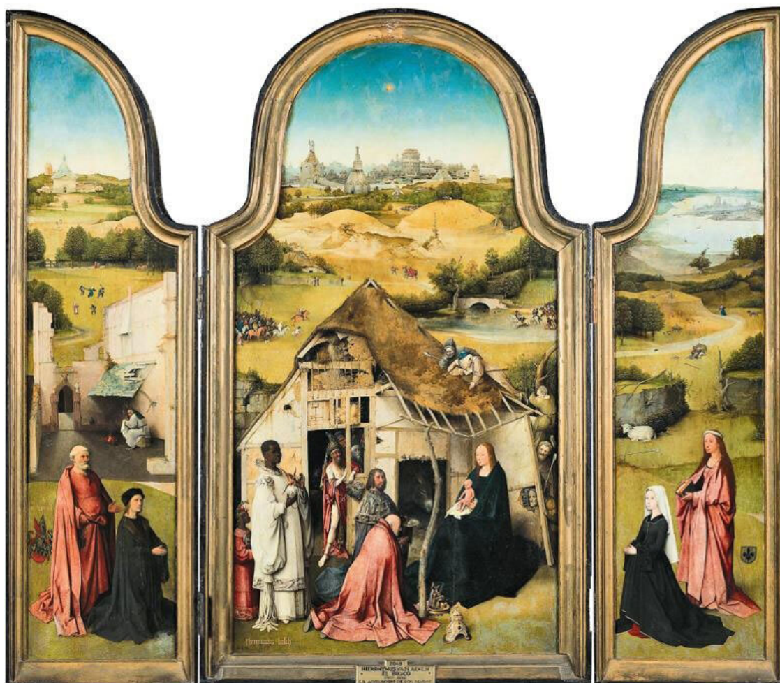
Рис. 1. Иероним Босх. Поклонение волхвов, ок. 1490–1500 гг. Madrid. Museo Nacional del Prado. № P002048