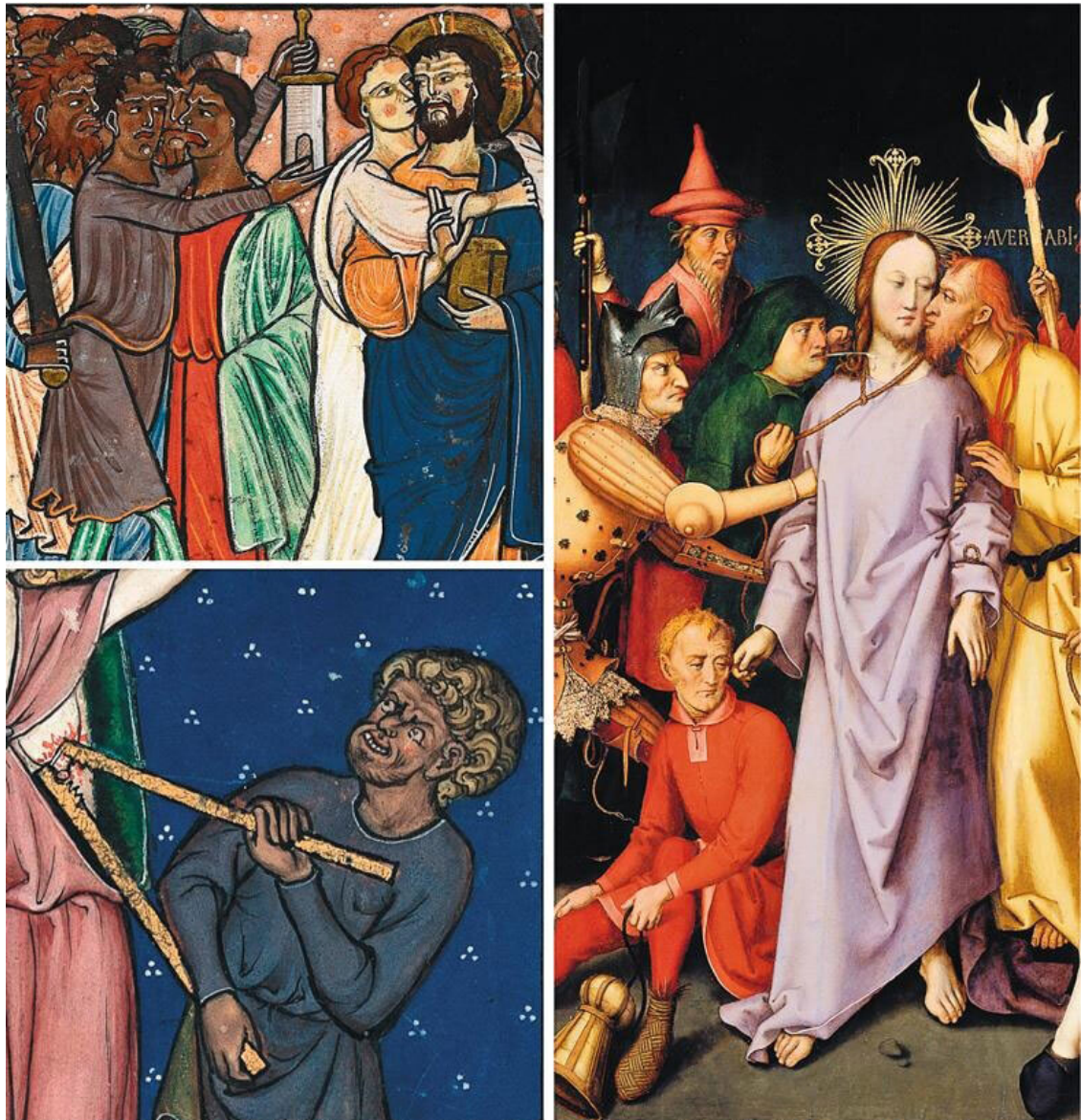
Рис. 7. Слева сверху: Арест Христа в Гефсиманском саду. Псалтирь. Англия, первая четверть XIII в.

London. British Library. Ms. Royal 1 D X. Fol. 5v