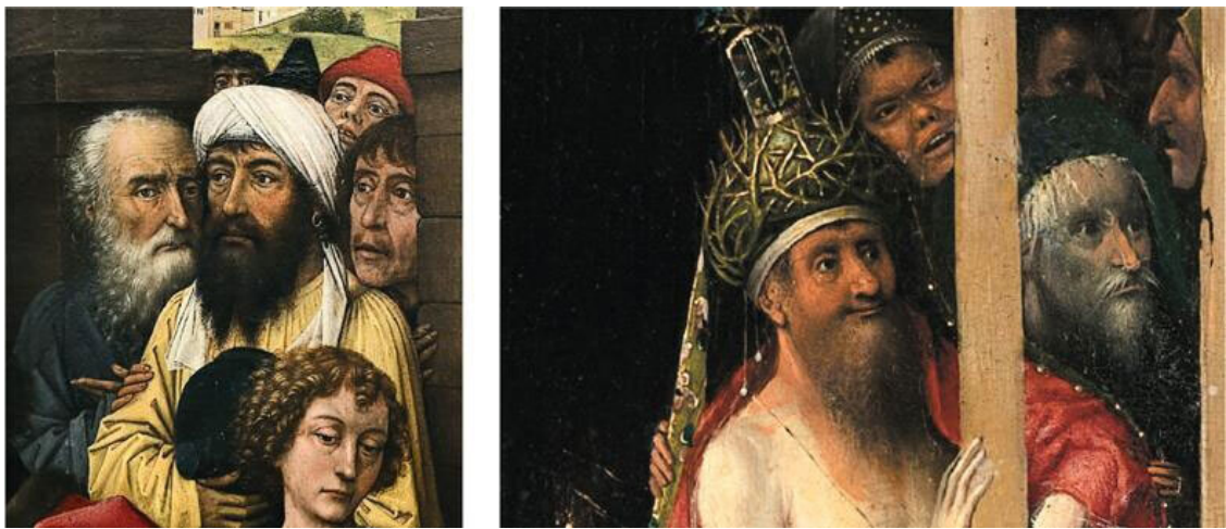
Рис. 12. Слева: Рогир ван дер Вейден. Поклонение волхвов (центральная панель алтарного образа из церкви св. Колумбы), ок. 1455 г.

В дверях хлева, в котором родился Иисус, стоит бородатый мужчина в тюрбане, с золотой серьгой в ухе и в длинном желтом одеянии. Его можно было бы принять за кого-то из свиты трех королей. Однако он держится очень величаво и скорее напоминает еврейского (вспомним о символике желтого) вельможу. Только не ясно, признал ли он в новорожденном, на которого ему показывает старик, мессию или, наоборот, олицетворяет неверие. Из-за его спины, как у Босха, выглядывают какие-то люди – его собственные придворные или советники? (рис. 12) 36 .