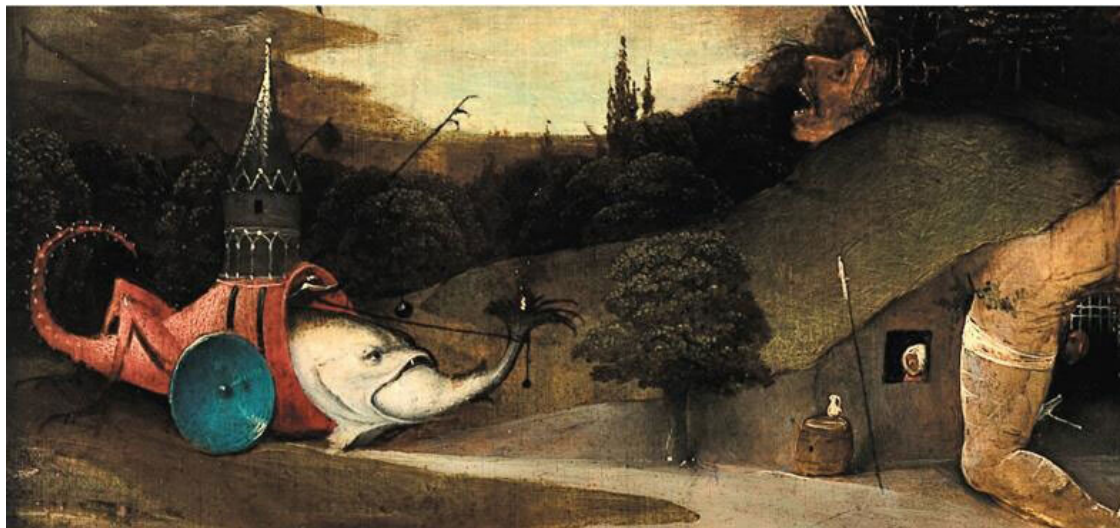
Рис. 5. Иероним Босх. Искушение св. Антония, ок. 1500–1510 гг. Lisboa. Museu Nacional de Arte Antiga. № 1498

Но что значат оставшиеся детали: ножки и хвост насекомого, синий вогнутый щит, на котором это сооружение может катиться, стоящая у него наверху готическая часовня и, наконец, демон (а может быть, человек), который с помощью веревки заталкивает мелкую рыбку в пасть большой? Важно ли, что хвост этого фантастического создания похож на скорпионий? Ведь в средневековых текстах скорпионы часто олицетворяли дьявола и иноверие, а в житии св. Антония говорилось, что демоны осаждали аскета в образах разных зверей и гадов: львов, леопардов, змей, ехидн и скорпионов. На спине монстра стоит часовенка. Потому некоторые исследователи предполагают, что вся эта дьявольская конструкция изобличала алчность духовенства... Подобные толкования могут звучать убедительно или совершенно фантастично. Но они всегда подразумевают, что у Босха каждая деталь наделена смыслом, а каждый образ устроен как визуальный ребус. А это абсолютно не очевидно. Многие детали явно требовались для того, чтобы вызвать у зрителя изумление или страх, напомнить ему о хитрости дьявола и изменчивой многоликости зла, но сами по себе ничего не значили.