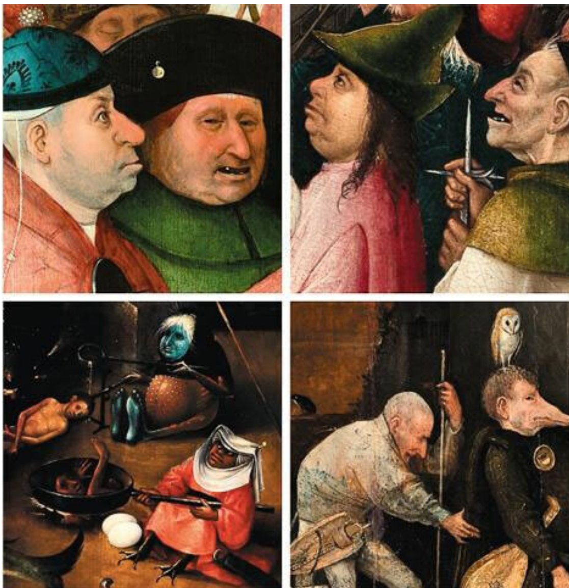
Рис. 6. Иероним Босх. Лица демонов и грешников – фрагменты панелей «Несение креста» (Эскориал), «Се человек» (Франкфурт), «Страшный суд» (Вена), «Искушение св. Антония» (Лиссабон).

Йерун ван Акен был необычайно изобретателен в изображении дьявола, грешников и всего мира зла. В его сценах Страстей, не говоря уже об inferнальных пейзажах, собраны почти все приемы и знаки, с помощью которых североевропейские мастера его времени и предшествующих столетий демонизировали врагов Христа и христианства (рис. 6). Мы видим и зловеще-темные лица, и крючковатые носы, и зверские grimасы, и восточные одежды, и фантастические гербы с жабами или скорпионами, которые соотносили иноверцев и грешников с их «отцом» – дьяволом. При этом, обличая зло в его бесконечных формах, Босх создал собственный визуальный «диалект», который для нас далеко не всегда понятен.