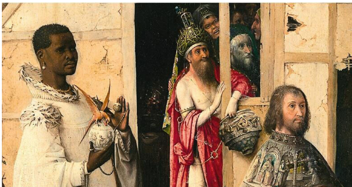
Рис. 3. Иероним Босх. Поклонение волхвов, ок. 1490–1500 гг.

Этот странный триптих давно интригует историков. Американский искусствовед Джо-зеф Кёрнер в книге, посвященной Босху и Брейгелю, сформулировал свое впечатление так: «В "Эпифании" [к Христу] из своих дохристианских культур приходят волхвы с таинственными идолопоклонническими дарами, которые как-то связаны с секретным заговором (его суть до сих пор неизвестна и, возможно, необъяснима) с участием еще одного короля» 9 . Другие исследователи: от Лотты Бранд Филип в 1950-х гг. до Дебры Стрикленд в 2010-х гг. – предполагали, что в этой сцене Босх не только славил божественного младенца и его явление миру, но и обличал врагов Церкви – иудеев и (или) магометан, что радостное торжество у него омрачено ощущением смутной угрозы и волхвы тоже, возможно, враждебны младенцу 10 .