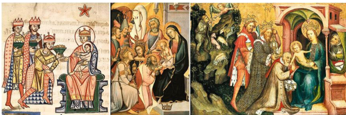
Рис. 2. Слева: Оттобойренский коллектар. Южная Германия, последняя четверть XII в. London. British Library. Ms. Yates Thompson 2. Fol. 62v Посередине: Бартоло ди Фредди. Поклонение волхвов, ок. 1390 г. New York. The Metropolitan Museum of Art. № 1975.1.16 Справа: Среднерейнский мастер. Поклонение волхвов, ок. 1400 г. Frankfurt am Main. Das Städel Museum. № SG 1002

В напоминание об этом событии был установлен праздник Богоявления (греч. – Эпифания, Επιφάνια ), который отмечается 6 января 5 . Вот как около 1260 г. разъяснял его смысл итальянский доминиканец Иаков Ворагинский – автор «Золотой легенды», популярнейшего свода житий святых: «Когда Иисусу исполнилось 13 дней, к Нему пришли волхвы, которых вела звезда. Потому Эпифания происходит от epi , что значит сверх, и phanos – явление, ибо в тот день в высях появилась звезда, или же Сам Христос через звезду, которая воссияла над Ним, был явлен волхвам как Истинный Бог» 6 . В следующем столетии немецкий доминиканец, а потом картузианец Лудольф Саксонский (ок. 1295–1378) в «Житии Христа» говорил о том, что в день рождения богочеловек был явлен еврейским пастухам. Однако из их народа почти никто не принял Слово Божье. В лице волхвов Спаситель предстал перед язычниками, и они, в отличие от иудеев, наполнили Церковь 7 .