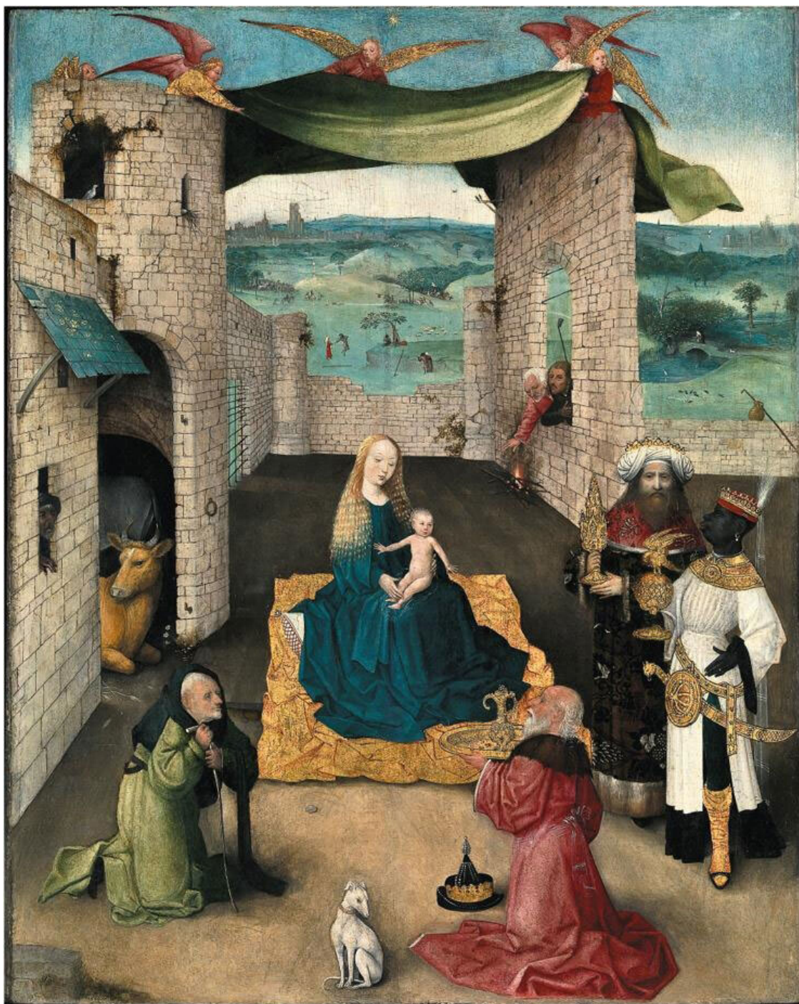
Рис. 9. Иероним Босх. Поклонение волхвов, ок. 1470–1480 гг. New York. The Metropolitan Museum of Art. № 1913, 13.26