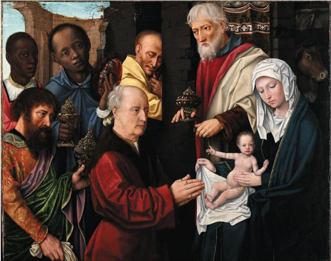
Рис. 10. Трое волхвов перед младенцем Христом, сидящим на коленях у Девы Марии. Старший из них стоит на коленях, сложив руки в жесте молитвы. Он уже передал свой дар седовласому Иосифу. Как и у Босха, чернокожего волхва с серьгой в ухе сопровождает чернокожий слуга.

Рыжеволосый персонаж в желтом, который смотрит не на младенца, а на волхвов, и выглядывает из руин, судя по его облику, принадлежит к миру зла. В нидерландском и немецком искусстве того времени желтый устойчиво ассоциировался с иноверием и в первую очередь с иудаизмом. Да и рыжий цвет волос пользовался самой дурной репутацией. Рыжих подозревали в особой склонности к обману, лицемерию и предательству. Потому Иуду Искариота очень часто представляли в желтой одежде, с рыжими волосами и красным, под стать прическе, лицом. Здесь, в сцене Богоявления, странный персонаж в желтом, возможно, олицетворял ветхий еврейский мир, не признавший Иисуса мессией.