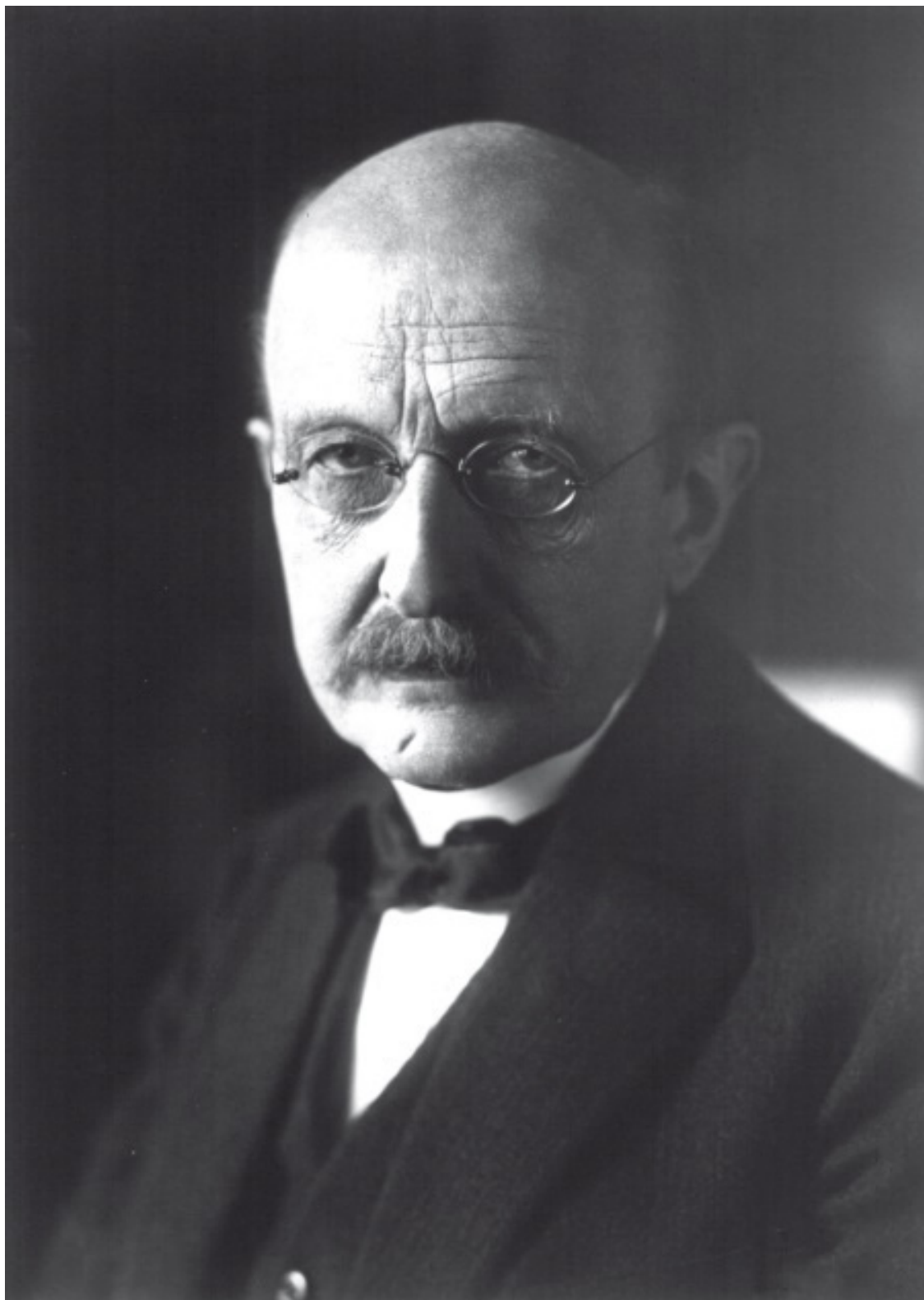
Рис. 1.1. Макс Планк, основатель квантовой теории, совершивший революционный переворот в нашем понимании атомных и субатомных процессов.

В 1900 году Планк сообщил о своем решении проблемы «ультрафиолетовой катастрофы»: вместо того чтобы быть непрерывной, энергия распространяется маленькими порциями, которые он назвал квантами. Но Планк совершенно не имел представления о том, почему энергия должна быть именно такой, и поэтому назвал свое решение «актом отчаяния». Он не