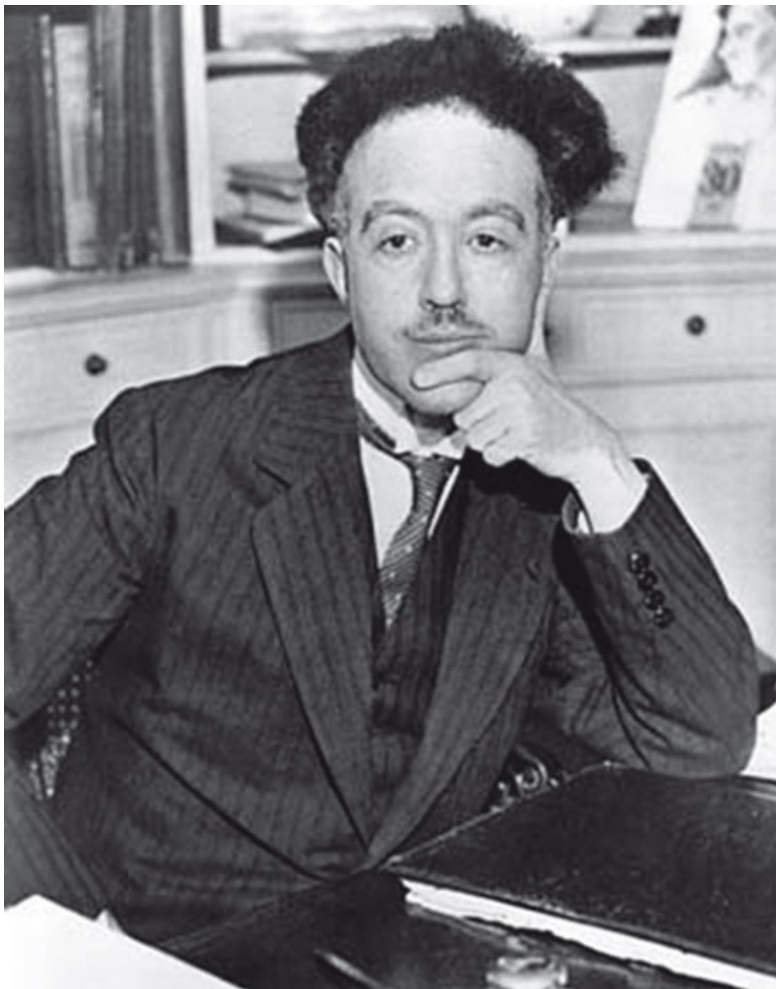
Рис. 1.3. Луи де Бройль, продемонстрировавший, что электроны, являющиеся частицами, ведут себя так же, как и волны.

В 1927 году Вернер Гейзенберг (1901–1976), один из лучших студентов Бора, понял, что одним из следствий корпускулярно-волнового дуализма является фундаментальное ограничение, налагаемое им на количество информации о физической системе, которое можно получить в принципе. Чем точнее мы измеряем положение частицы, тем меньше мы знаем о ее импульсе. Эта неопределенность не имеет ничего общего с практическими трудностями измерения в масштабах фотонов и электронов – это фундаментальная особенность Вселенной. Гейзенберг показал, что на квантовом уровне положение и импульс объектов не являются отдельными свойствами, как в нашем повседневном мире. Квантовые объекты имеют смесь