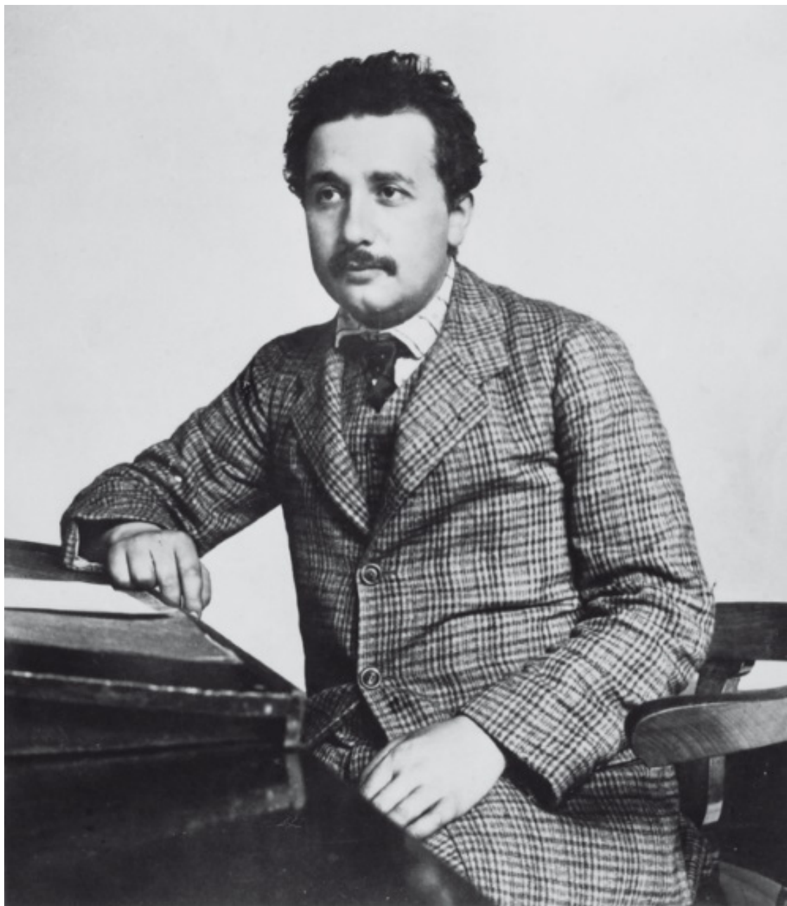
Рис. 1.2. Альберт Эйнштейн в 1904 году. Работа над фотоэлектрическим эффектом привела его к выдвижению концепции фотона.

Бор решил эту проблему, предположив, что электроны обращаются вокруг ядра по орбитам из дискретного набора и не могут существовать между любой парой этих орбит. Если они перепрыгивают с одной орбиты на другую, то излучают фотоны. Его расчеты частот этих фотонов отлично согласовывались с результатами экспериментов того времени. Это было еще одним подтверждением того, что свет испускается маленькими порциями, энергия которых соответствует разностям уровней энергии электронов.