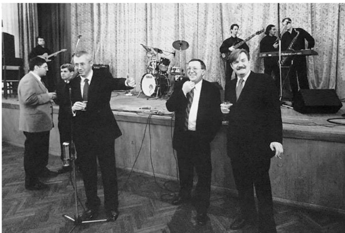
Руководители телеканала НТВ (справа налево): Евгений Киселев, Владимир Гусинский, Игорь Малашенко и Олег Добродеев

Александр Коржаков рассказывает спустя 25 лет, что это он скомандовал начать операцию против Гусинского – по требованию Ельцина. Якобы президент разозлился из-за того, что его жена Наи́на куда-то ехала и перед ней перекрыли дорогу из-за кортежа Гусинского. Вот Ельцин и приказывает «разобраться с Гусинским». О своих контактах с Березовским Коржаков почему-то не упоминает, хотя предполагает, что Березовский мог повлиять на президента через Юмашева. И, конечно, Коржаков не может скрыть собственной неприязни к Лужкову. (Семья Ельцина настаивает, что операция была личной инициативой Коржакова: Наи́на Ельцина не любит быстрой езды и никогда не жаловалась на кортеж Гусинского.)