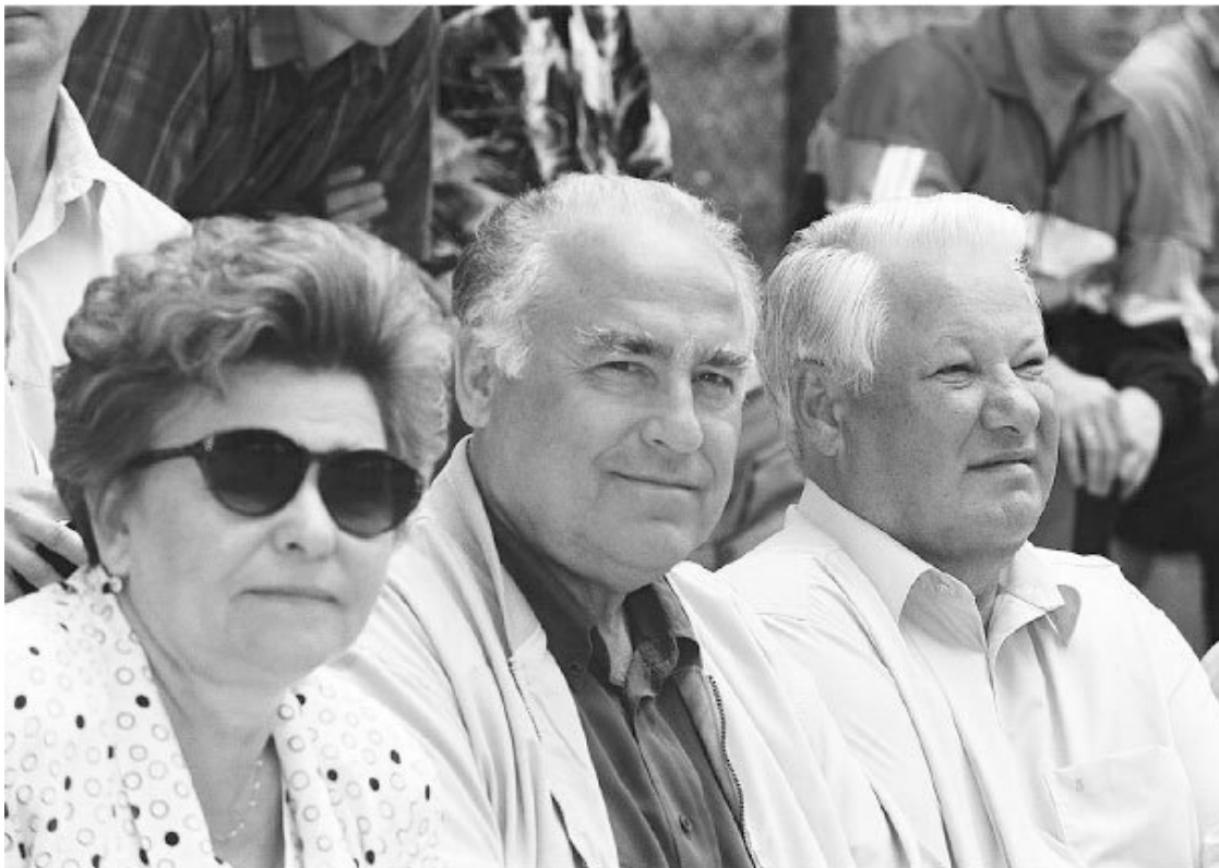
Наина Ельцина, Виктор Черномырдин и Борис Ельцин Фонд «Президентский центр Б. Н. Ельцина»

В июне 1989 года министр газовой промышленности СССР пришел на заседание Совета министров Советского Союза с революционной идеей. Он предложил ликвидировать его министерство. Участники заседания не верили своим ушам: им казалось, что министр сошел с ума. Министра звали Виктор Черномырдин.