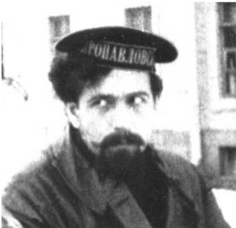
Матрос Дыбенко П.Е.

Ему послали следующее послание: «Тебе же, предавшему революцию, Бонапарту-Керенскому, шлем проклятья в тот момент, когда наши товарищи гибнут под пулями и снаряда-