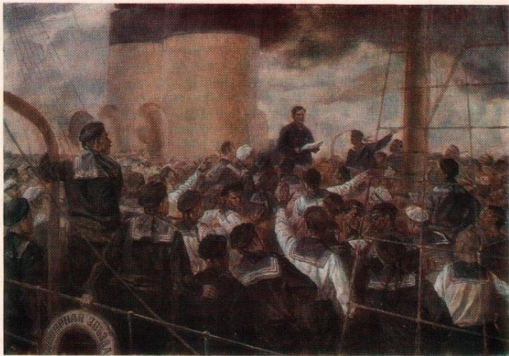
"Моряки-делегаты Пъезда Балтфлота. Гельсингфорс". В.А. Серов

В это время в Гельсингфорсе обострились отношения между большевистской и анархистской матросскими группировками. Анархисты попытались было отбить у большевиков матросский клуб, но сами были избиты активистами с линкора "Республика". Большевики явно приобретали все больший авторитет. 9 сентября в Гельсингфорсе открылся третий областной съезд депутатов армии, флота и рабочих Финляндии. Съезд был созван областным комитетом депутатов. Под давлением большевиков, на съезде был избран новый