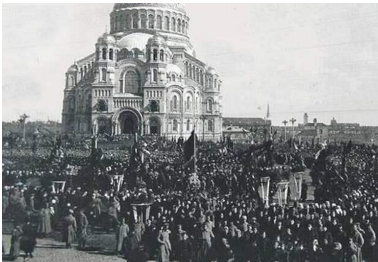
Митинг на Якорной площади по случаю провозглашения «Кронштадтской республики». Фото 1917 года

Таким образом «мосты были сожжены». Назад дороги Центробалту не было. Подобные решения принимали и другие демократические организации флота. С этого момента Балтийский флот полностью вышел из подчинения Временному правительству и в управление им фактически вступил Центробалт.