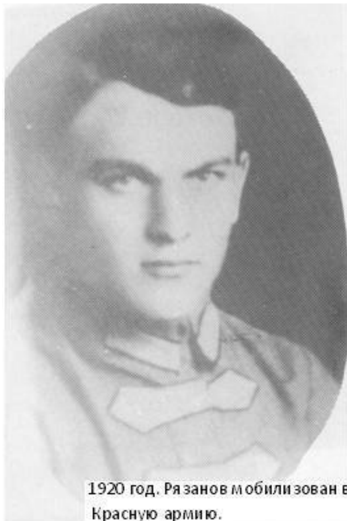
1920 год. Рязанов мобилизован в Красную армию.