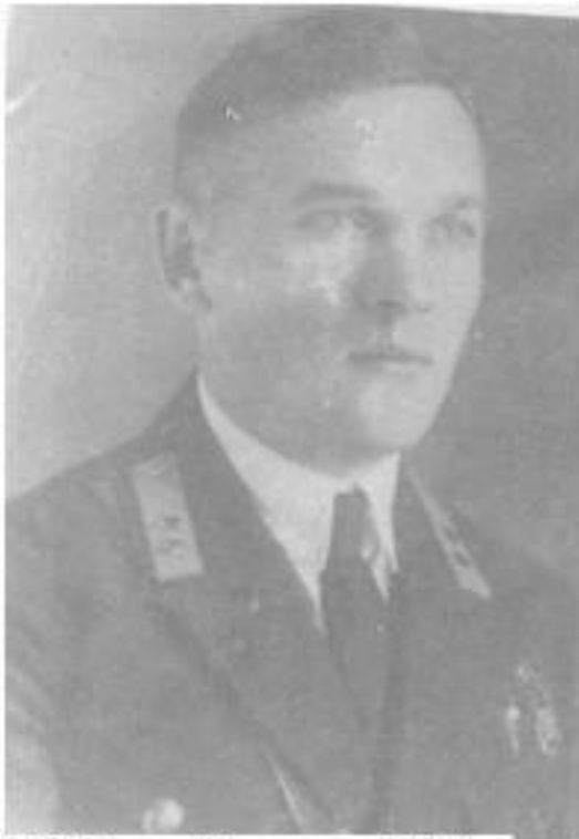
1935 год. Рязанов в ВВА.