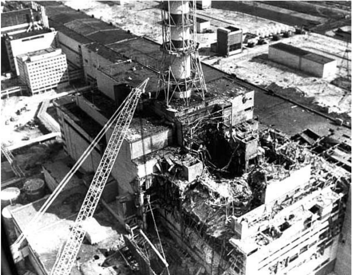
ЧАЭС – аварийный блок №4. Апрель 1986 года

Только в 2006 году дата 14 декабря – день принятия в эксплуатацию защитного сооружения (объекта "Укрытие") – Указом Президента Украины был назван днём чествования участников ликвидации последствий аварии на Чернобыльской АЭС. Мы его называем " День ликвидатора ".