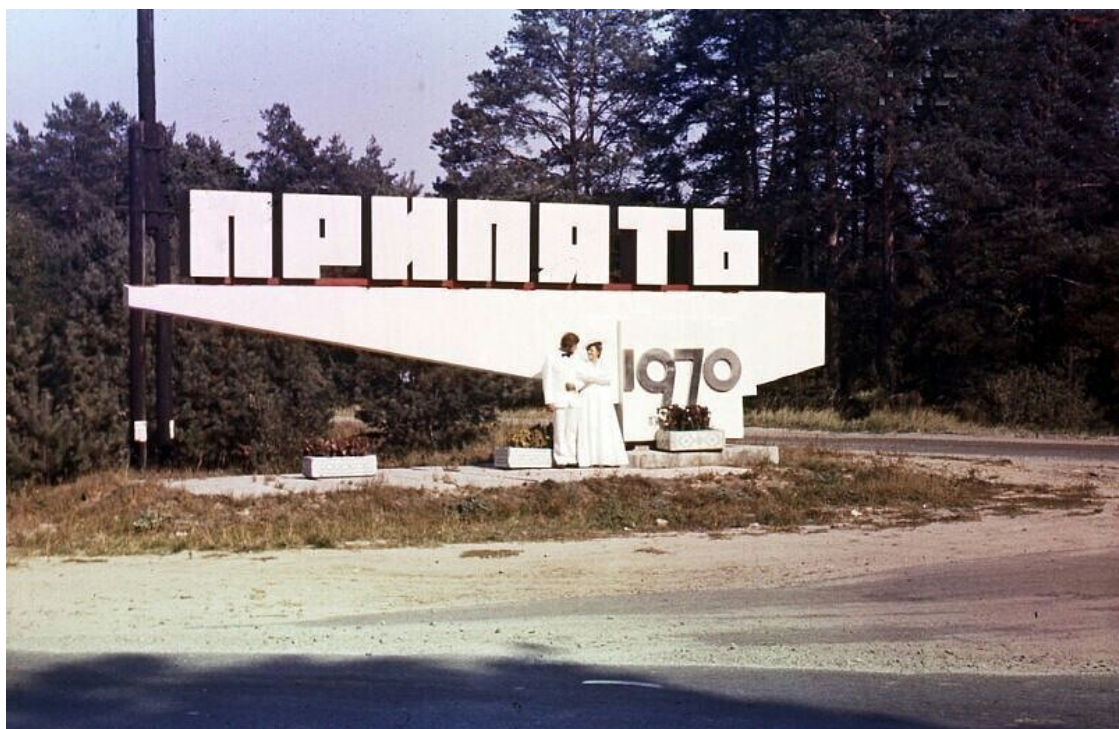
ПРИПЯТЬ до 26.04.1986 года