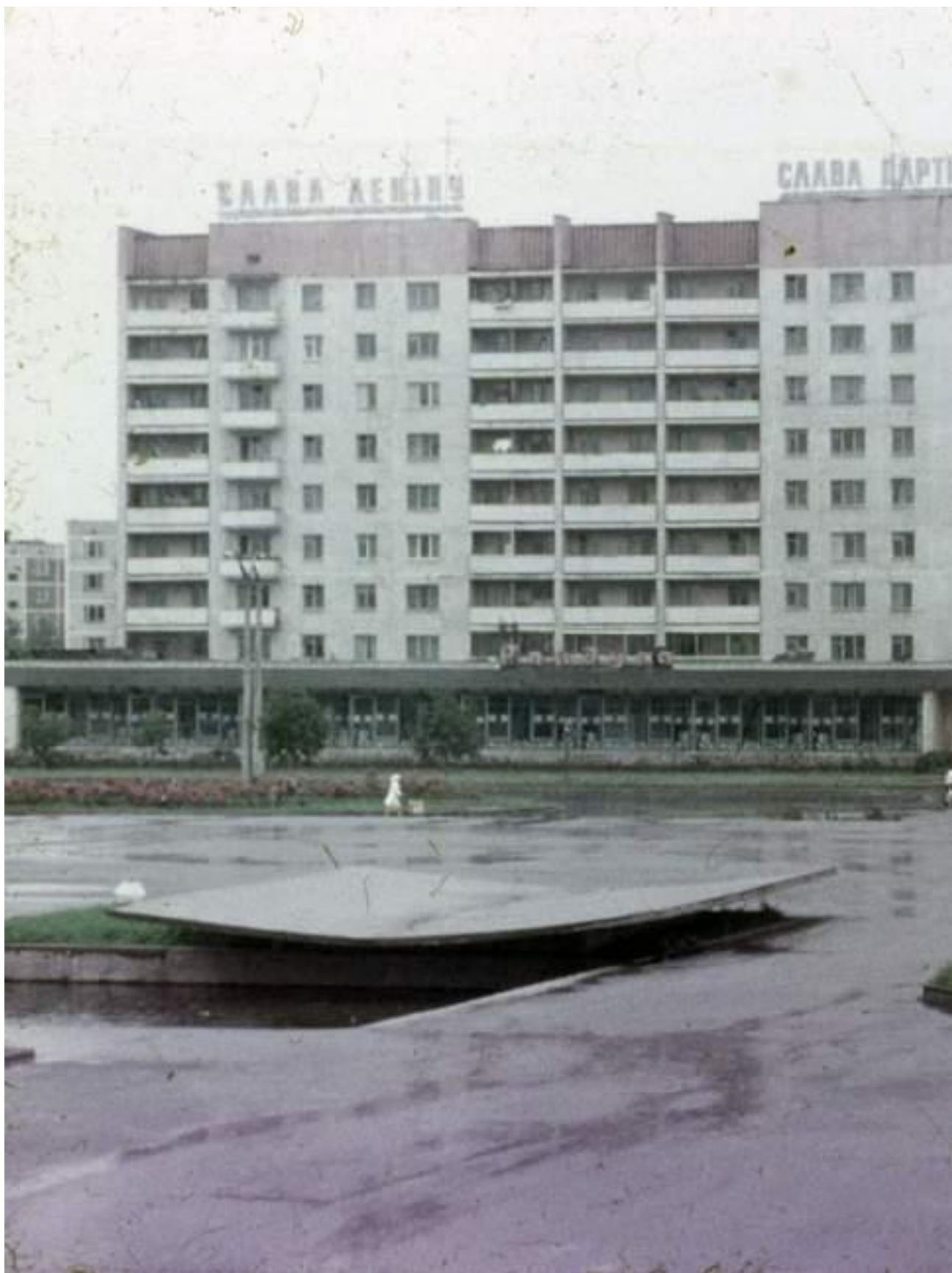
Центр города Припять – вот таким он был в то утро 26 апреля 1986 года

В тот день, 26 апреля, на главной площади города было шумно и людно. Открылся новый универмаг, а это в то время – событие. Здесь же рядом Дворец культуры и гостиница "Поле-