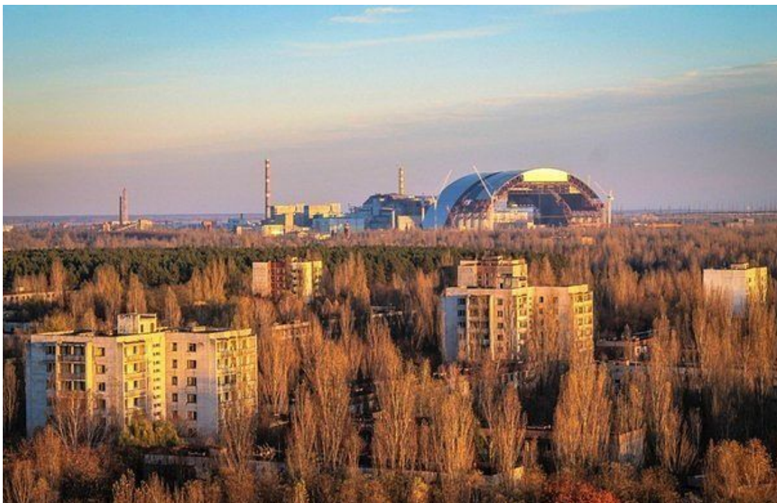
Строительство «Новой арки»