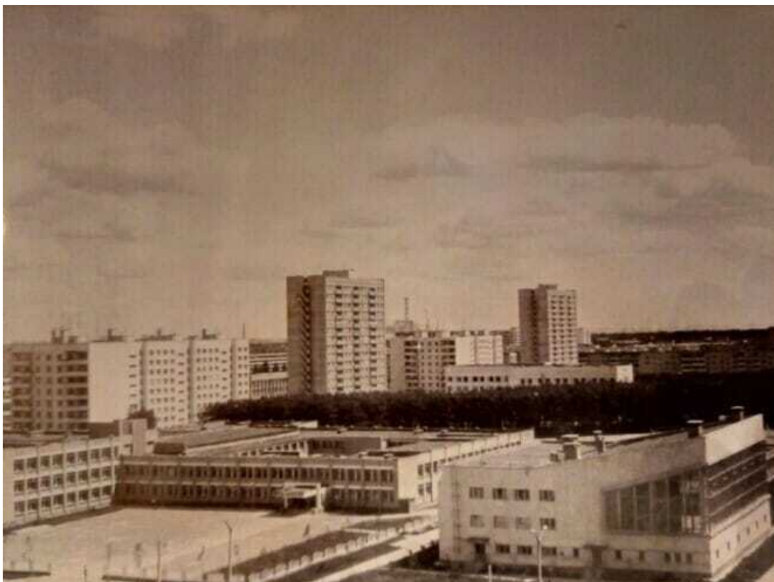
Школа №3 и бассейн «Лазурный»