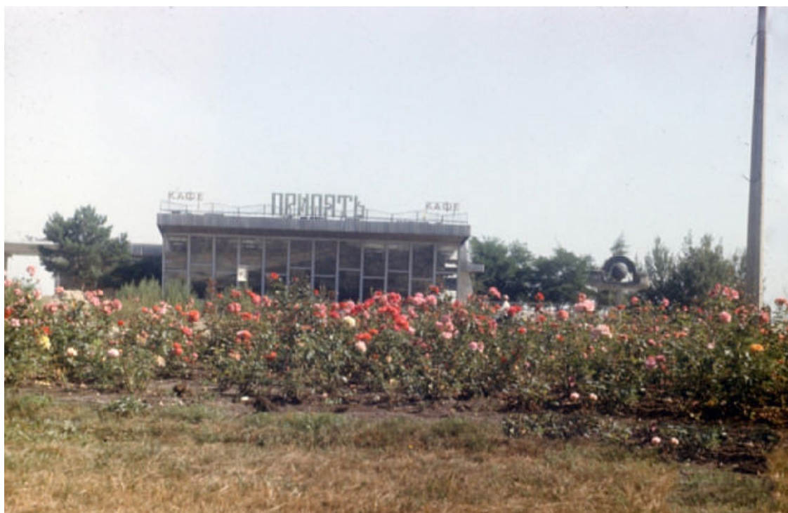
Кафе у реки Припять