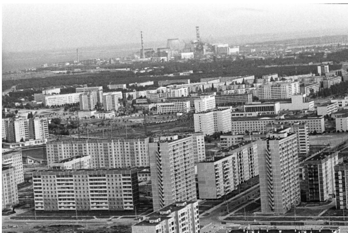
Панорама с видом на ЧАЭС