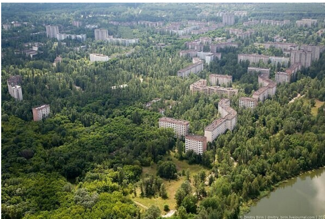
Мой дом – последний у воды. Проспект Строителей, дом 40

Вернулся я в Чернобыль к ночной смене, "и снова в бой – покой нам только снится". А вот спать нам приходилось мало. В середине лета мы переехали в Глебовку, это за Дыме-