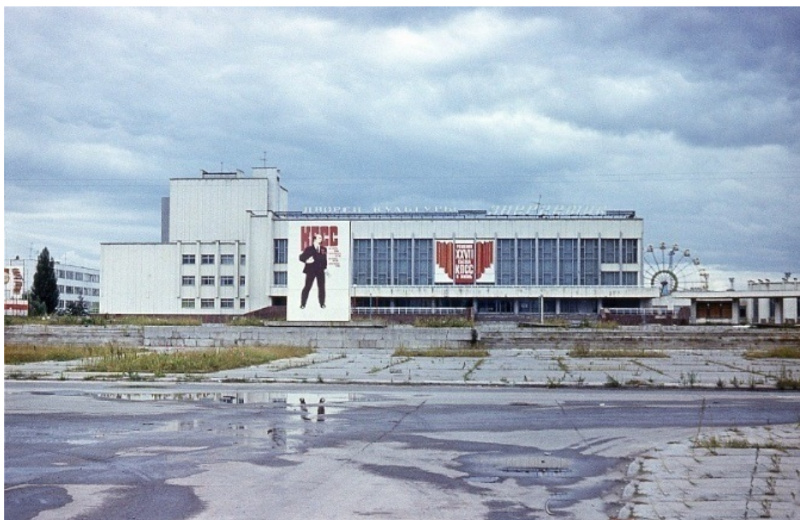
дворец культуры «Энергетик»