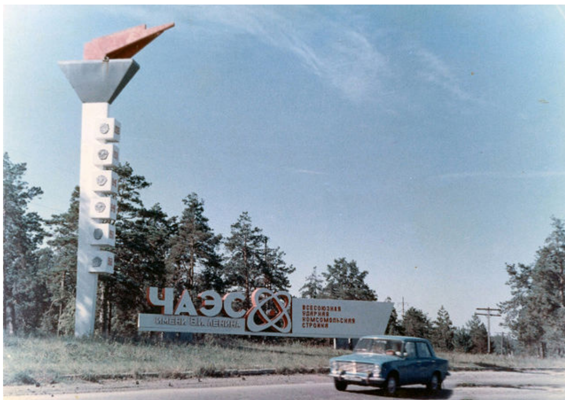
Стелла "Факел". Дорога на Припять

Где-то в июле 1986 года я после работы в ночь, немного осмотревшись, днем решил пробраться в Припять, в свою квартиру. Я не был там уже почти три месяца, тяжело чувствовать себя бездомным и неприкаянным. Утром на попутной поливочной машине поехал в город. От Чернобыля до Припяти – 18 км. Кроме того, что дороги постоянно поливались водой, обочины были обработаны бардой и латексом, чтобы закрепить песок и пыль, для предотвращения пылепереноса. Его распыляли специальные машины и военные вертолеты. Этот раствор, после застывания, образовывал пленку, похожую на целлофан, если на нее наступить ногой, она хрустела, как сахарная. Дорога проходила через выселенные села Лелев, Копачи, мимо "рыжего леса" – на "факел". В районе Копачей был устроен пункт перегрузки, где из миксеров бетон перегружали в самосвалы, с которыми уже на блоке работали бетононасосы. Таким образом, разделялись машины на условно "грязные" и "чистые". Машины, которые ходили по маршруту Копачи – ЧАЭС, были обречены, они были самые грязные и дальнейшая их судьба – могильник. У водителей было два понятия "факел" – это поездка на 4 блок, и еще в районе "рыжего леса" была стелла – "Комсомольская ударная стройка – ЧАЭС", в форме факела, она и сейчас стоит, только надпись "ЧАЭС" убрали, да ордена комсомольские отпали.