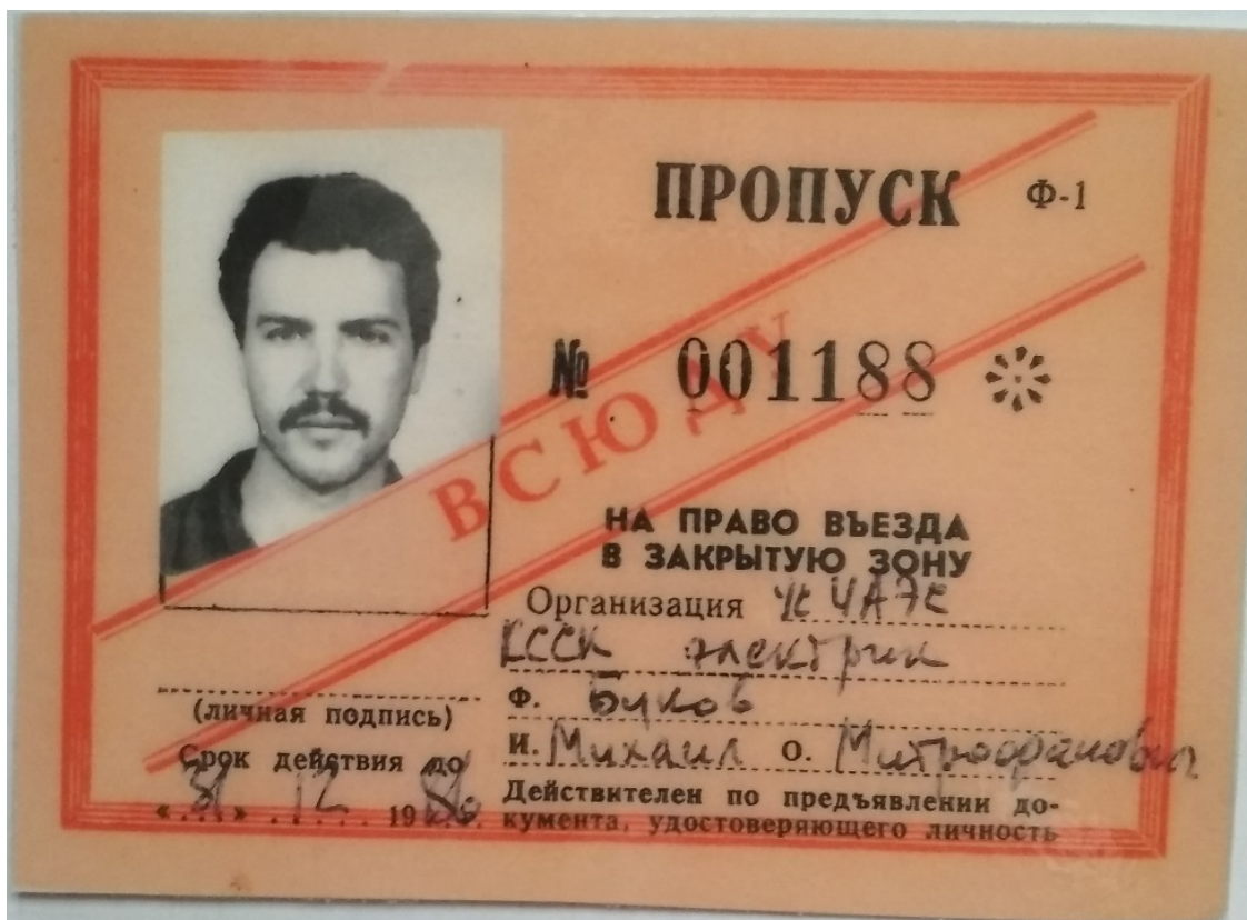
Мой первый пропуск в «зону отчуждения»