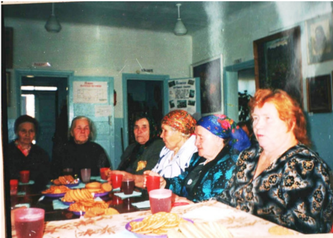
Дети тесинских репрессированных

Что делать человеку, у которого нет семейных архивов? Есть только фамилия репрессированного... Например, если человека сослали в Красноярский край, на него, как минимум, заведена карточка. В архиве – это картотека алфавитная, и поэтому если известна фамилия, да ещё и отчество, с годом рождения – то это «подарок судьбы». Иначе, могут быть варианты.