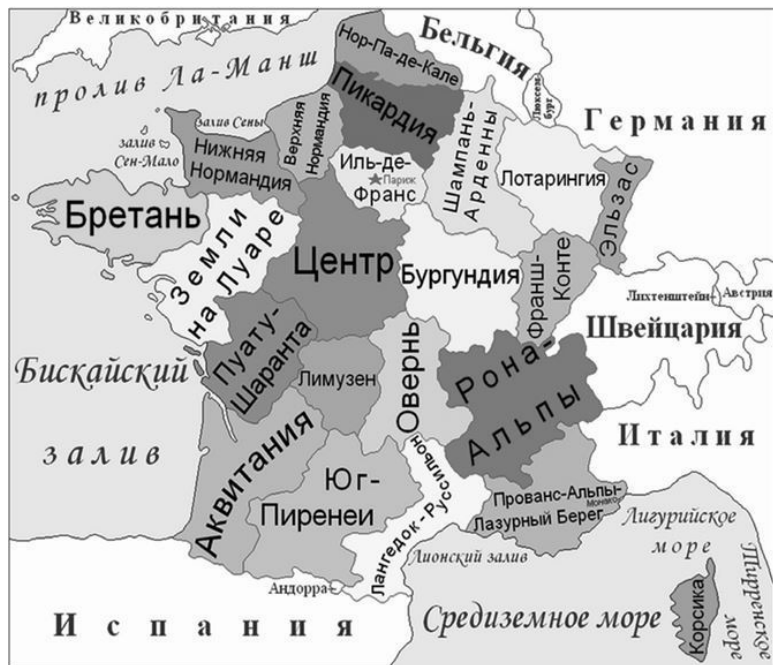
Рис. 2. Исторические провинции Франции

Риччи, Бальмэн, Пако Рабан, Лакруа и др.), ювелирное искусство (Ван Клиф и Арпелз, Бушерон, Мобуссен и др.).