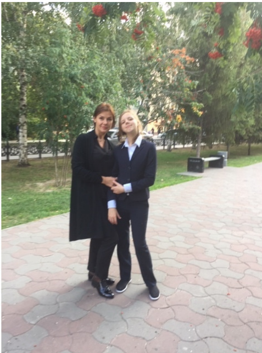
Арина с мамой

Остановится свет. Ее глаза вразумились. И правда ведь, все ясно Но я, не слушая красную стрелку, Обратила ее слова в дорогу, На которой никто не ходит.