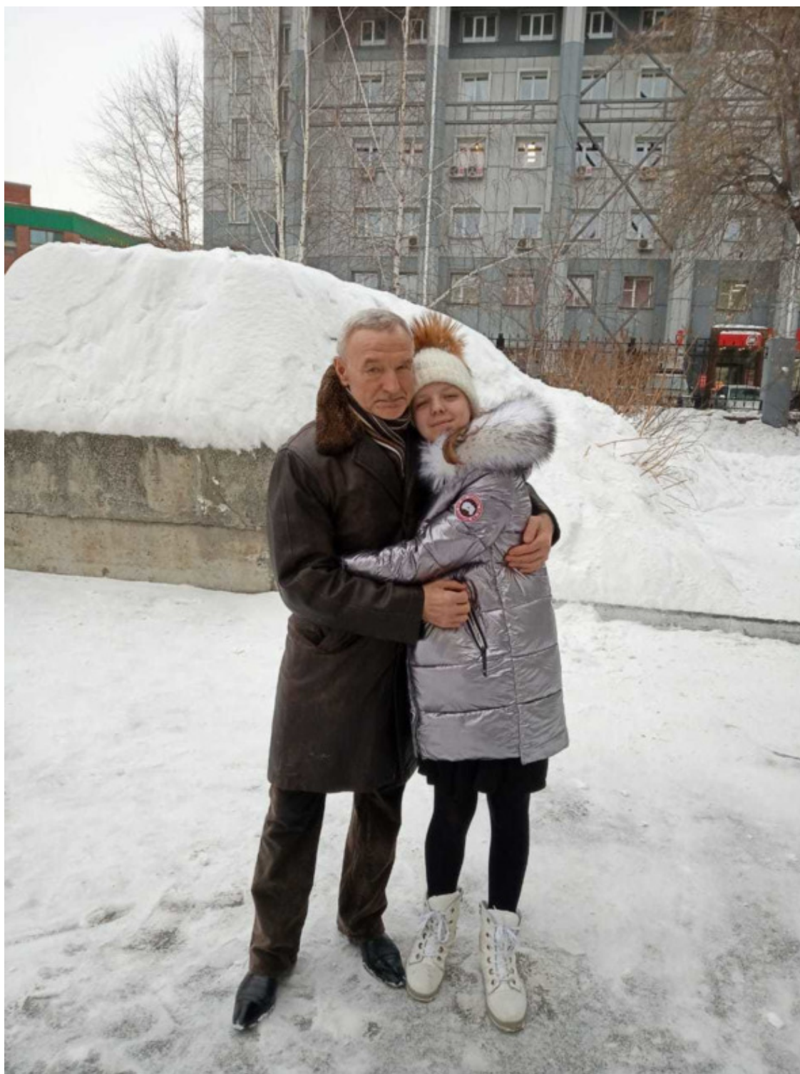
Арина с папой