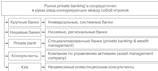
Рис. 2. Основные операторы рынка

2) private bank – финансовые учреждения, специализация которых – исключительно работа с состоятельными клиентами. На Украине в настоящий момент подобных решений не существует. Примером могут выступать только представительские офисы именитых брендов, которые сосредоточены исключительно на предоставлении услуг международного консалтинга и продают услуги в основе своих зарубежных структур. Более успешно это направление бизнеса развивается в России;