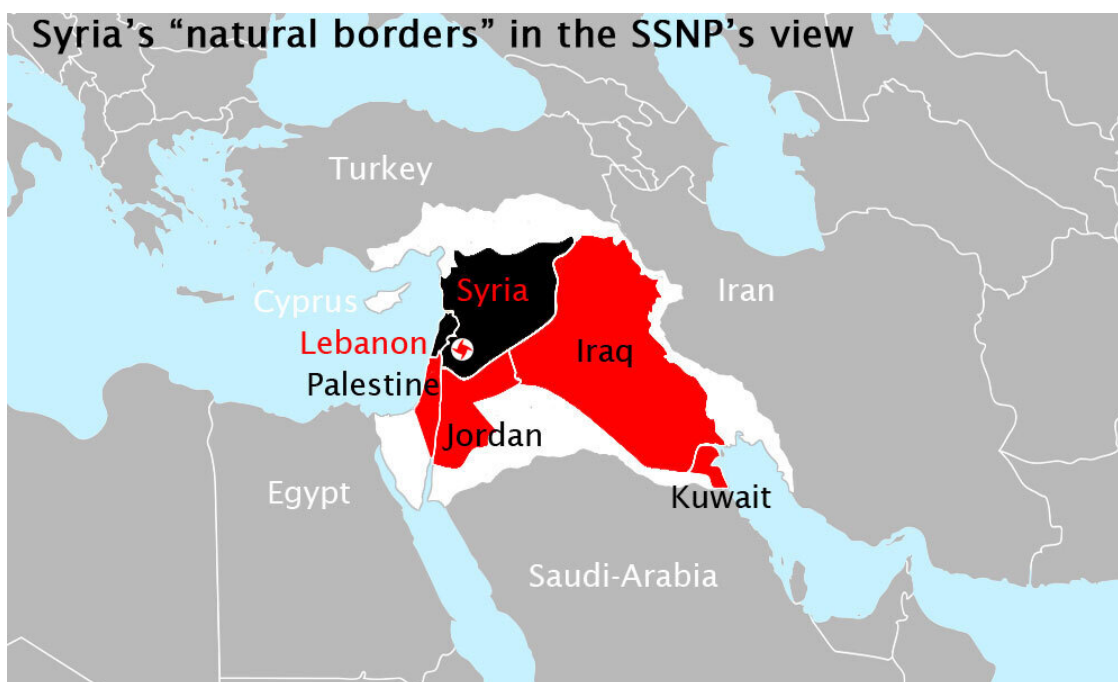
Илл 2. Проект «Великая Сирия»