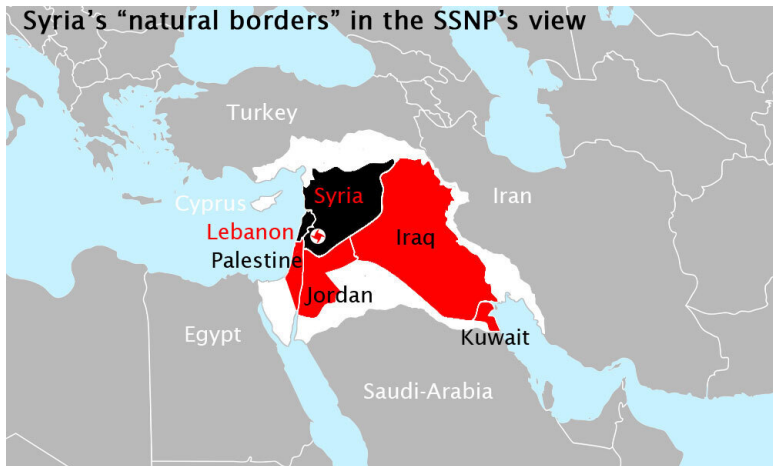
Илл 2. Проект «Великая Сирия»