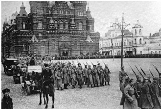
Красная Армия и другая, менее белая армия..

Была ли гражданская война в России страшной, унесшей жизни 13 миллионов россиян, и причиной ее извержения стала группа внешних и внутренних факторов. Поскольку между большевиками и западными правительствами существовали стабильные проблемы по многим причинам, в том числе неспособность большевиков выплатить долг, который Российская империя была обязана Британии, и их выход из Первой мировой войны, а также позорное соглашение Сайкса – Пико.. все это подтолкнуло Великобританию и великие державы отдать приказ о ликвидации такого враждебного их машинам правительства через поддержку недовольных большевистской революцией. Наиболее заметными из этих усилий были, конечно, дворянство, феодалы и буржуазия, которые захватили революцию, свою собственность и свою землю и раздали ее крестьянам и рабочим. Состав армии вызвал Белую армию на финансирование Запада, и именно в этой армии есть офицеры, лояльные царю, националисты, социалисты, умеренные и помогающее им духовенство. Красная армия состояла из миллионов рабочих и крестьян, которые стояли на стороне большевиков, опасаясь завоеваний, достигнутых ими в тени революции.