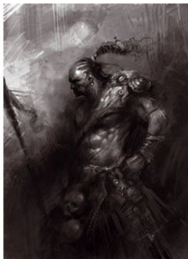
Работа ателье по обустройству своих армий