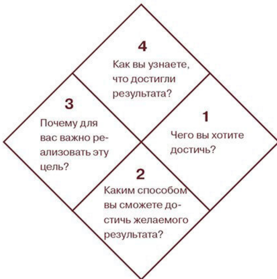
Рис. 2. Постановка целей – преднамеренный процесс