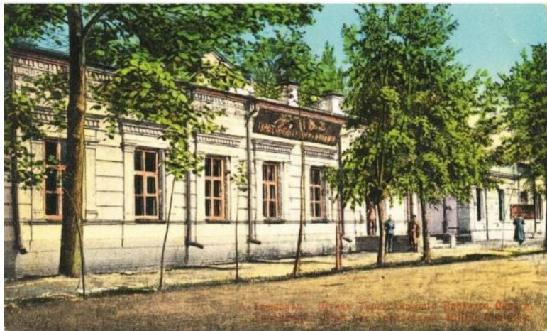
Печатна Централ, Београд, 1911 г.