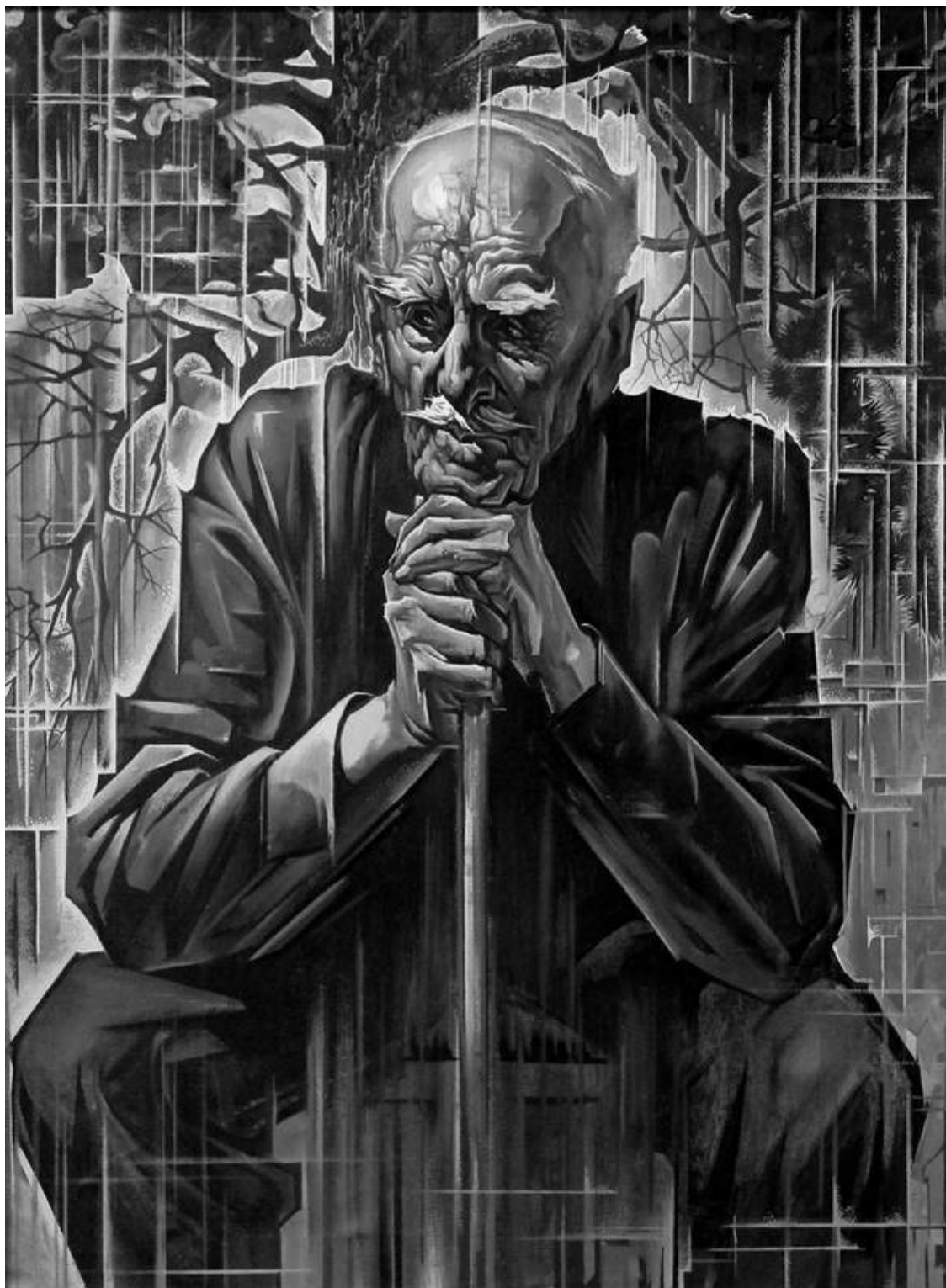
Высокий худощавый старик сидел у раскидистой сосны и думал о чем-то своем, писательском