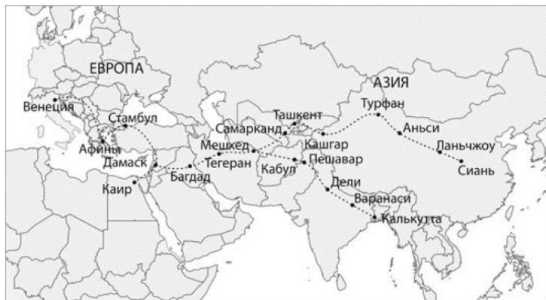
Рис. 1. Великий шелковый путь

ведшему на запад из Индии и Китая, а далее – по Средиземному морю. В середине XV века преградой для перевозки товаров стала набирающая влияние исламская Османская империя, центр которой приходился на территорию, занимаемую современной Турцией. Османское государство сначала закрыло дорогу, а затем существенно подняло пошлины на провозимые товары. Европейцам был крайне важен этот торговый маршрут, но Османская империя взвинтила цены до невообразимого уровня.