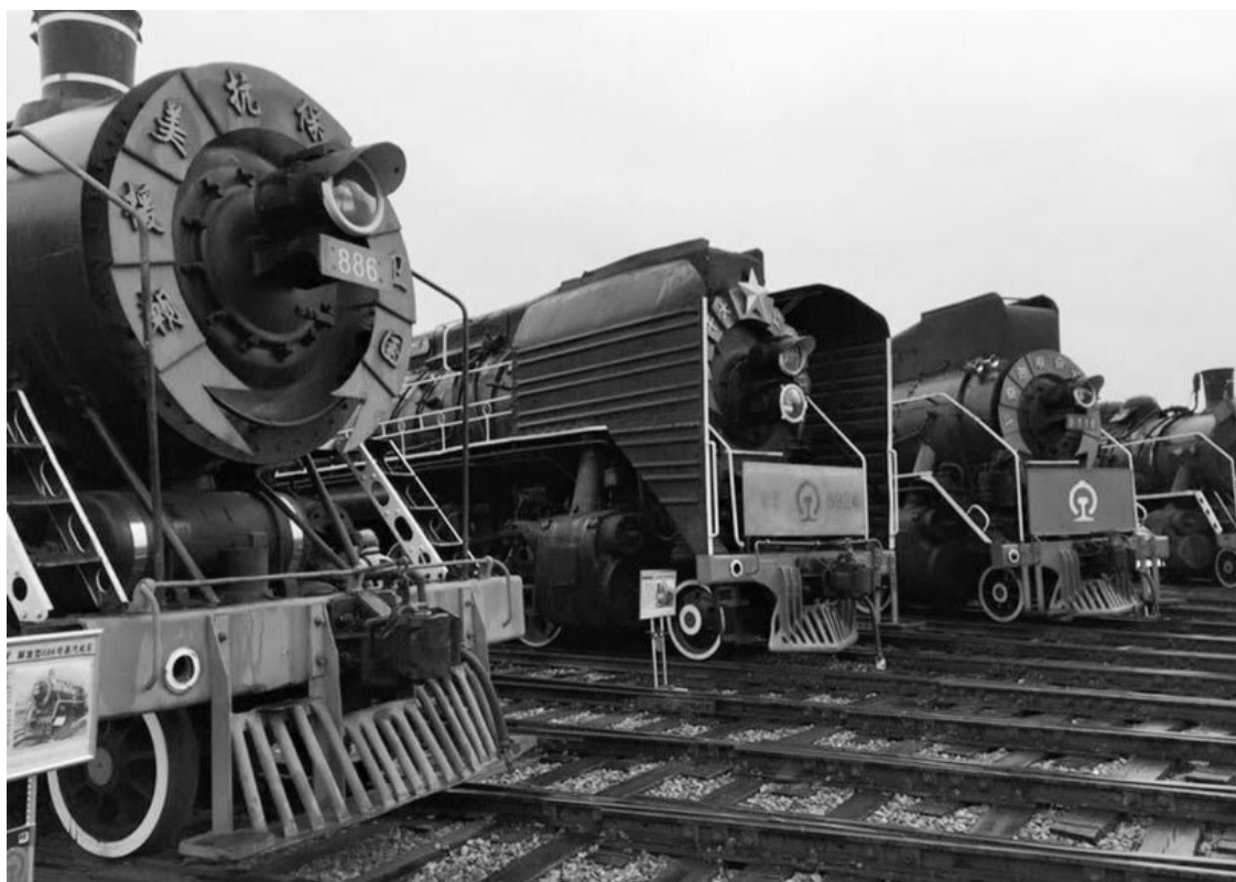
Хэндаохэцзы – русский поселок на КВЖД (2015 г.)