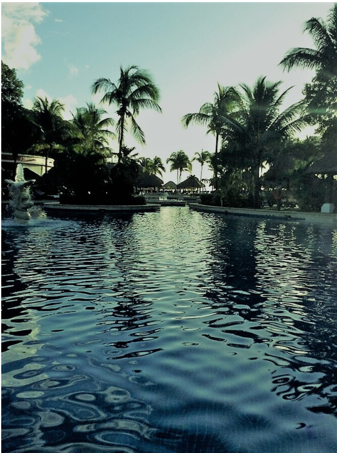
На курортном мексиканском берегу.

Тот год неудачно сложился для меня. Сначала был переезд и его потери. Пропавшие в переезде ящики лучших книг и разные вещи, которых позже хватились, и общая неразбериха в бумагах и вещах. Затем катаракта, о которой мне давно объявляли и которая накапливалась и вдруг проявилась разом, потребовав внимания к себе. Потребовалась операция. Через день после неё повязку с моего правого глаза сняли, но чуда не произошло. Глаз также видел, как через мутное стекло. Хирург снова так и сяк рассматривал мой глаз через свою аппаратура, а