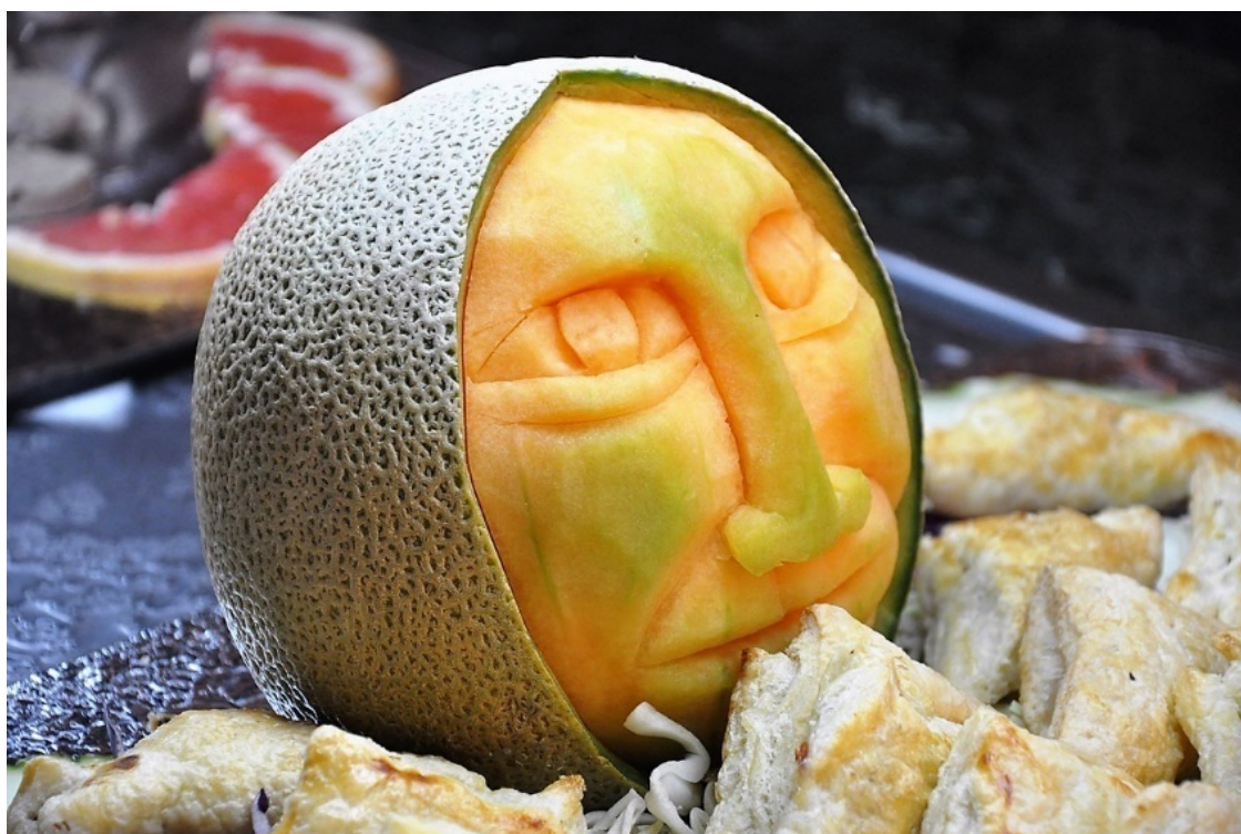
«Ольмекская голова» из дыни.

Мобильный телефон они считали атрибутом цивилизации и теперь не отрывали его от уха в любых местах. Вереща не переставая, они тем самым как бы самоутверждались. И когда на них оборачивались, они делали удивлённые глаза: как можно осуждать такое культурное занятие, как телефонный разговор? «Научили на свою голову, – думалось мне вместе с нелестным сравнением с говорящими попугаями.