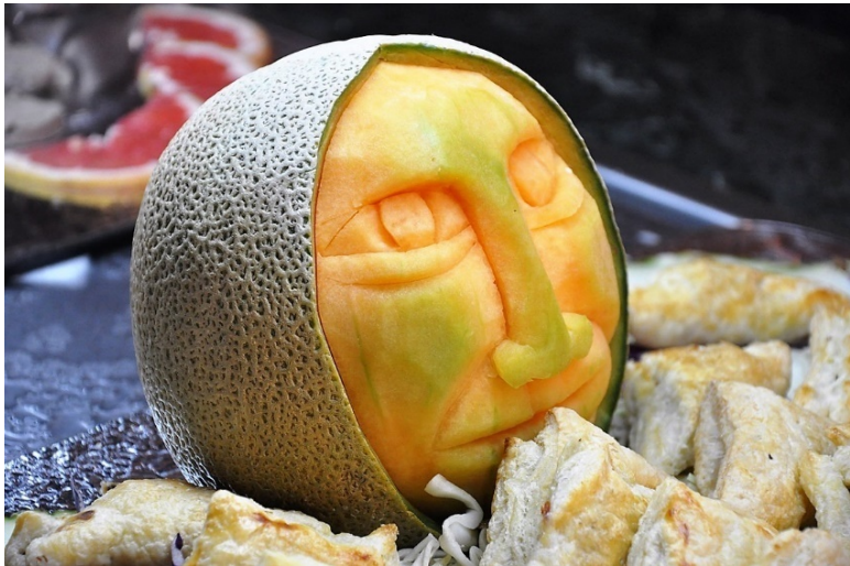
«Ольмекская голова» из дыни.

Чернокожие, встречные на тротуаре спуска, приветствовали тебя ослепительной улыбкой, которая не оставляла сомнений, что если так дело обернётся, то эти встречные тебя с удовольствием съедят. Причём за милую душу и с улыбкой, не заморачиваясь. Мы с ними взаимно даже в какой-то мере гарантировали это. Им будет кайф, а нам в любом случае просто некуда будет деться в силу политкорректности.