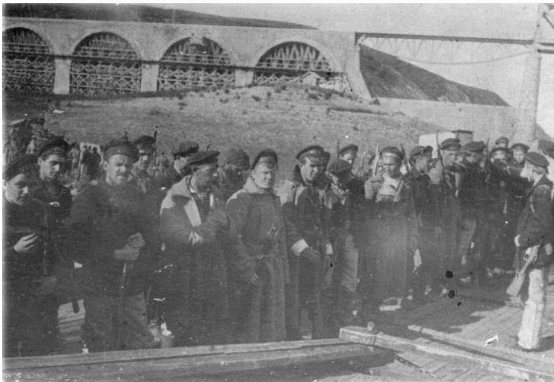
Формирование матросского отряда

Немало левых ошибок допускали большевики, когда твердый стратегический курс у них еще отсутствовал или, когда особенно крутым ходом событий он ставился под сомнение. Так, они, как и другие партии, сразу после бурных февральских событий на флоте обратили самое пристальное внимание на усиление своего влияния в матросских массах. И также стремилась это сделать по возможности левыми лозунгами. Первый же приезд делегатов большевистского центра (каковым являлся первое время Выборгский комитет) получил примечательный резонанс на заседании исполкома Петроградского Совета 4 марта с точки зрения симпатий к радикально настроенным матросам. Представители армии Кронштадта заявили, что «положение там очень серьезное благодаря столкновениям между матросами и сухопутными войсками» и особо подчеркнули, что приехавшие большевистские делегаты, «критиковавшие Временное правительство и Совет рабочих и солдатских депутатов, еще сильнее обострили положение». Но в своем дебюте в Кронштадте большевики оказались «левыми» скорее всего не заслужено. Просто они попали в момент, когда Кронштадт «протрезвел» и его качнуло вправо. Перехватившие (на время) инициативу у матросов солдаты искали подстрекателей. В целях усиления своего влияния среди матросов большевики считали само собой разумеющимся допускать левые эксцессы в матросской среде, чтобы стравливать между собой своих политических конкурентов. Но, конечно, главная