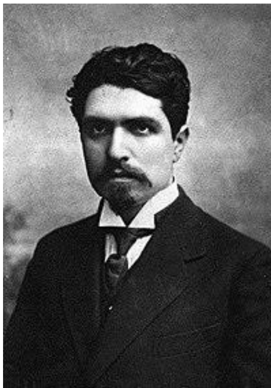
Степан Шаумян – председатель Бакинского Совета народных комиссаров