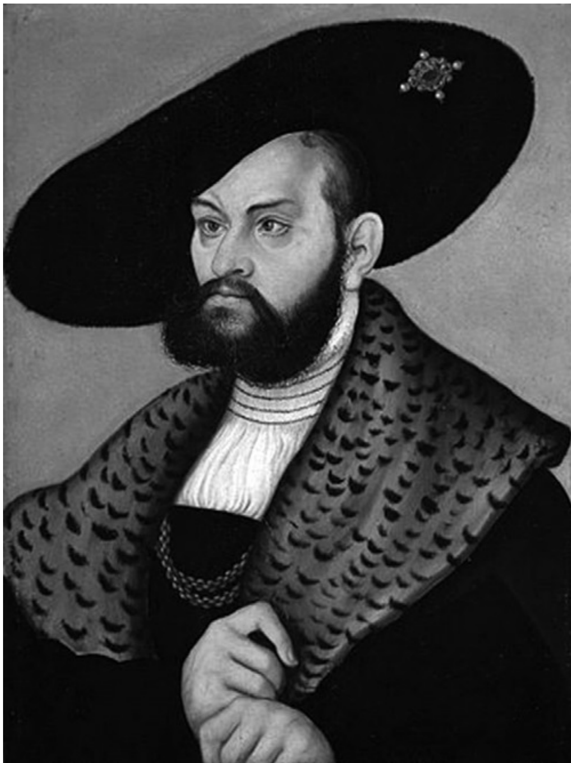
Герцог Пруссии Альбрехт Гогенцоллерн

Прусский черный орел признал верховенство польского белого орла. Казалось, закончилась многовековая борьба между Польшей и Тевтонским орденом. Не помогли Альбрехту ни союз с московским государем Василием III, ни поддержка императора Священной Римской империи и римской курии – после поражения в 1410 году под Грюнвальдом величие и слава Тевтонского ордена больше не вернулись.