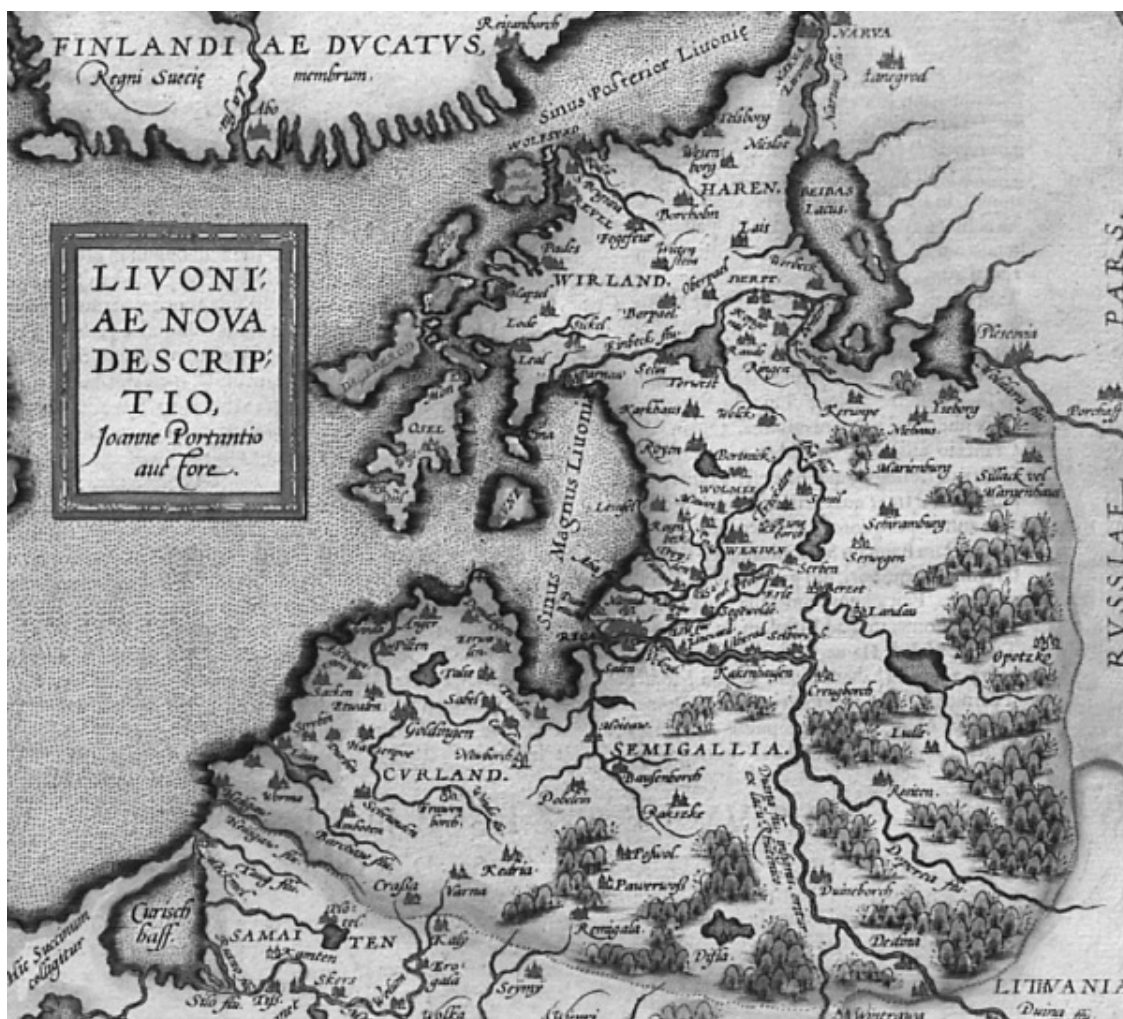
Ливония на карте из атласа Абрахама Ортелия. 1573 г.

Но не было бы счастья, да несчастье помогло. Объединение двух государств на более прочной основе способствовало тому, что конфликт с Москвой, ранее бывший делом преимущественно Великого княжества Литовского, теперь стал делом и Польши. И надо же было такому случиться, что в ходе очередной королевской «элекции» магнateria Речи Посполитой после долгих колебаний выбрала новым королем трансильванского князя Стефана Батория, энергичного и умелого военачальника. В 1578 году Баторий начал очередную в серии русско-польско-литовских конфликтов войну – Московскую (или Баториеву), которая продлилась до 1582 года и завершилась утратой Россией всех своих завоеваний в предыдущий период и в Ливонии, и в Великом княжестве Литовском.