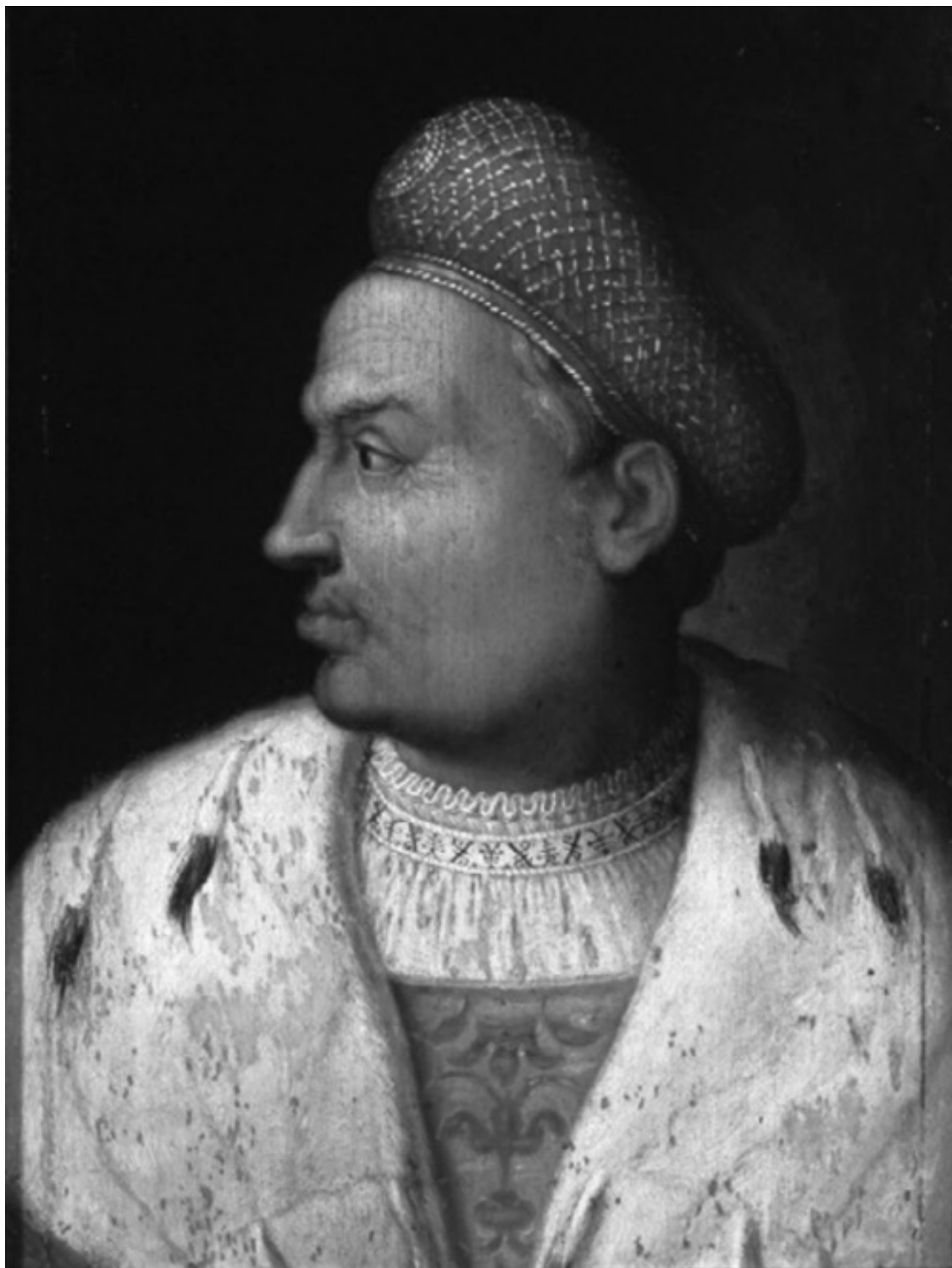
Сигизмунд I Старый

Эти соглашения положили конец «войне коадьюторов» и явно сместили баланс сил и интересов в регионе в пользу Польши – и, естественно, Великого княжества Литовского, соединенного с Польшей личной унией. Фактически Сигизмунд сделал первый шаг на пути, который в конечном итоге привел к разделу Ливонии между ее соседями – Польшей (с 1569 года Речью Посполитой), Данией, Швецией и Россией. Этот шаг Сигизмунда ускорил вмешательство России в ливонские дела, результатом чего и стала, собственно, Ливонская война, о которой было сказано чуть выше. С другой стороны, вторжение России в Ливонию ускорило начало Полоц-