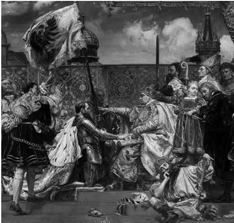
Я. Матейко. «Прусская присяга», фрагмент

Спустя чуть больше чем три с половиной столетия Ян Матейко напомнил полякам, государство которых к тому времени оказалось разделено между Австро-Венгрией (наследницей Священной Римской империи), Германией (наследницей Пруссии) и Россией (преемницей Московского государства), об этом событии.