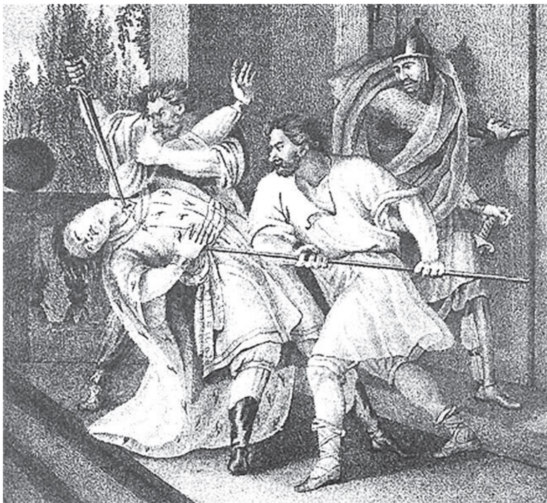
Б.А. Чориков. Убийство Ярополка, преданного воеводой Блудом