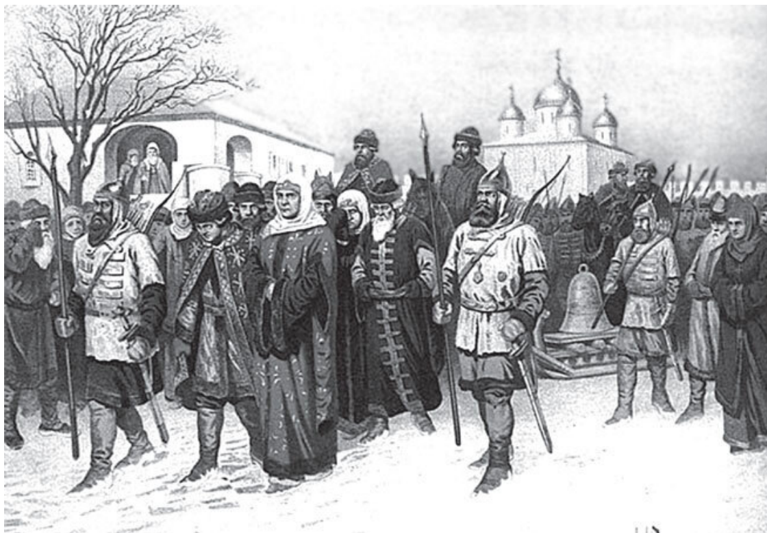
А.Д. Кившенко. Отправка Марфы Посадницы и вечевого колокола в Москву

В итоге новгородцы не решились воевать и сдались на милость победителя. Москва, прежде всего, уничтожила две самые ненавистные ей новгородские «выдумки». Вечевой колокол, созывавший когда-то всех здешних республиканцев на общее собрание, власть «арестовала», а единственную на всю Русь католическую церковь разрушила. В летописях уничтожение храма объяснялось «благочестивым сознанием русских», приписывалось «чудесному действию в наказание за то, что он (католический храм. – С. Г.) православной церкви Святого Иоанна Предтечи и что на внешней стороне храма были с целью отвращения русских написаны образа Спасителя и некоторых святых».