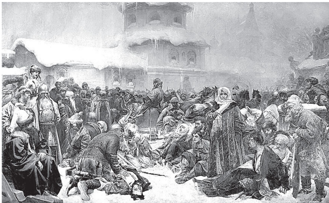
К.В. Лебедев. Марфа Посадница. Уничтожение новгородского веча. 1889 г.

Финалом стало противостояние, обозначенное в истории как Московско-новгородская война 1477–1478 годов. Сопrotивление новгородцев возглавила Марфа Борецкая. Новгородское войско в конце ноября 1477 года подступило к Новгороду, но не пыталось его штурмовать. На попытку Новгорода договориться Иван III отвечал: «Знайте же, что в Новгороде не быть ни вечевому колоколу, ни посаднику, а будет одна власть государева... как в стране Московской».