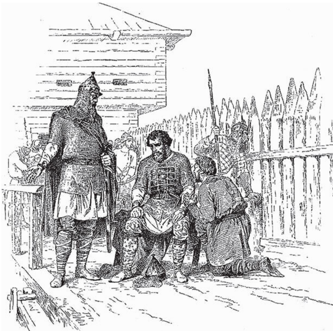
В.П. Верещагин. Великий князь Ярополк

Последний не внял предостережениям своего отрока, а Блуду все-таки удалось убедить его вступить в переговоры с Владимиром. Когда Ярополк прибыл на переговоры к брату, два варяга подло зарубили его. В «Повести временных лет» об этом говорится так: «И пришел Ярополк ко Владимиру; когда же входил в двери, два варяга пронзили его мечами под пазухи. Блуд же затворил двери и не дал войти за ним своим. И так убит был Ярополк». После чего Владимир занял киевский престол. Согласно «Повести временных лет», гибель Ярополка и вокняжение Владимира произошло в 980 году. По другим документам, это событие произошло на два года раньше.