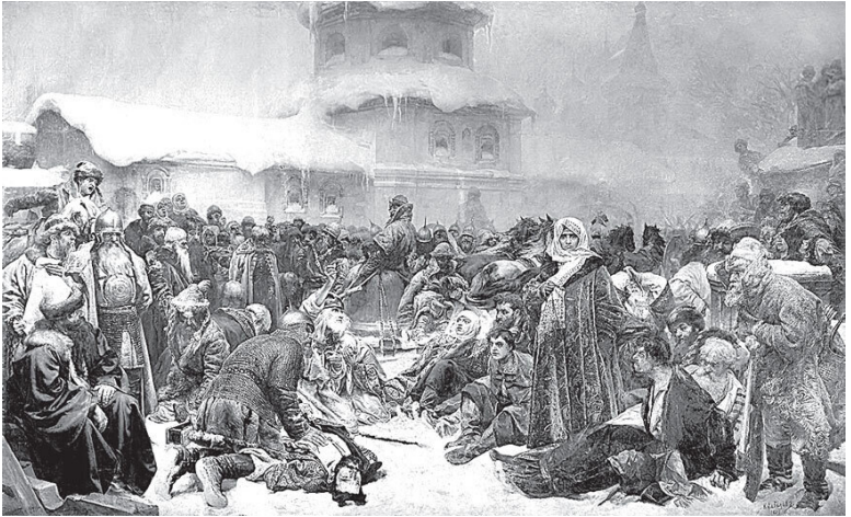
К.В. Лебедев. Марфа Посадница. Уничтожение новгородского веча. 1889 г.

города договориться Иван III отвечал: «Знайте же, что в Новгороде не быть ни вечевому колоколу, ни посаднику, а будет одна власть государева... как в стране Московской».