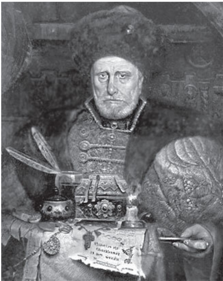
П.В. Рыженко. Портрет А. Курбского