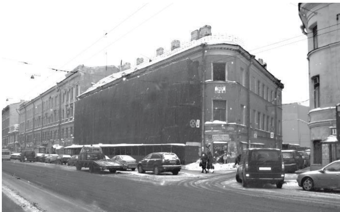
Загородный проспект, д. 3