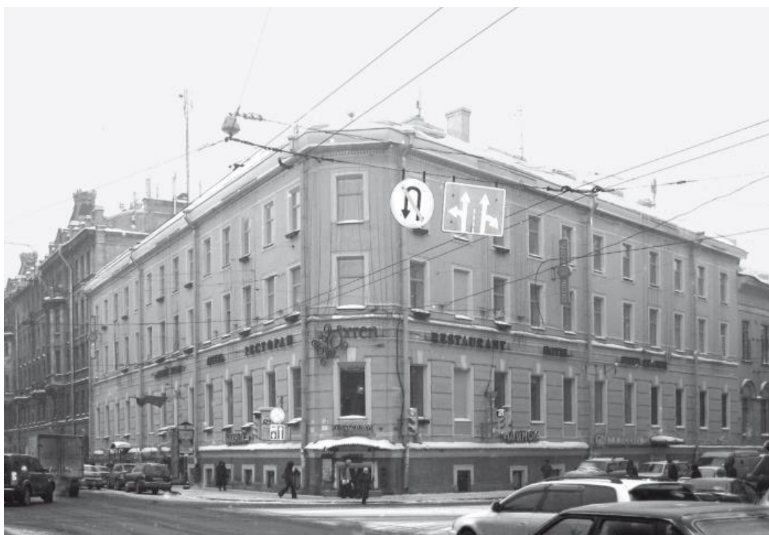
Загородный проспект, д. 11