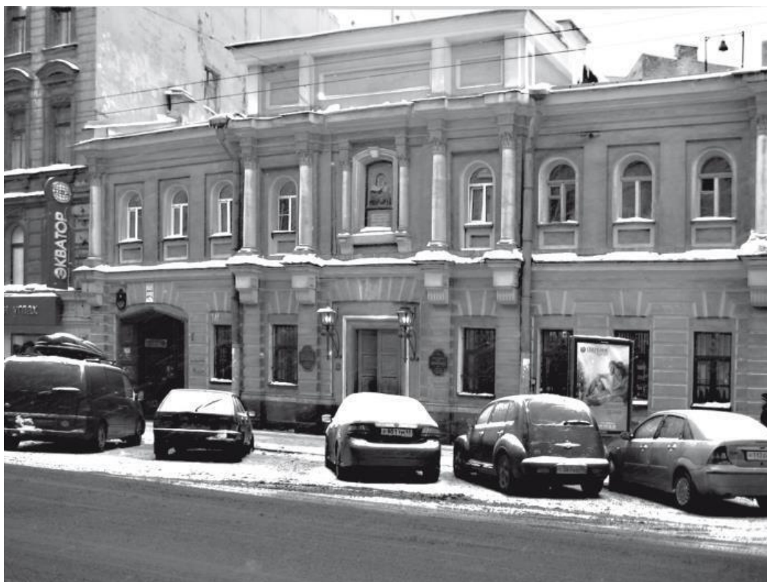
Загородный проспект, д. 7

В 1799 г. по благословию митрополита Новгородского и Санкт-Петербургского Гавриила (Петрова) иеромонах Варфоломей получил дозволение Святейшего синода возвратить святую икону в монастырь. По пути на Коневец отец Варфоломей на два месяца задержался в Петербурге, пока для иконы изготовлялась позолоченная серебряная риза.