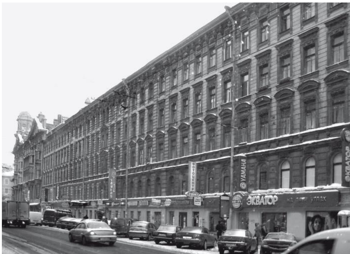
Загородный проспект, д. 9

В письмах к подруге Софья Михайловна описывала подробности своей жизни после замужества: «... <Дельвиг> особенно очарователен в своем интимном обществе, так как он застенчив и по большей части молчит, когда много народу, но в кругу людей, которые его не стесняют, он бывает очень приятен своей веселостью, а также люблю слушать его, когда он говорит о литературе... и я всегда бываю очарована его вкусом, правильностью его суждений и его энтузиазмом ко всему тому, что поистине прекрасно». В другом письме она писала: «Дельвиг – очаровательный молодой человек, очень скромный, но не отличающийся красотой мальчик; что мне нравится, так это то, что он носит очки» 20 . Насчет своих очков Дельвиг шутил: «В Лицее мне запрещали носить очки, зато все женщины казались мне прекрасны; как я разочаровался в них после выпуска».