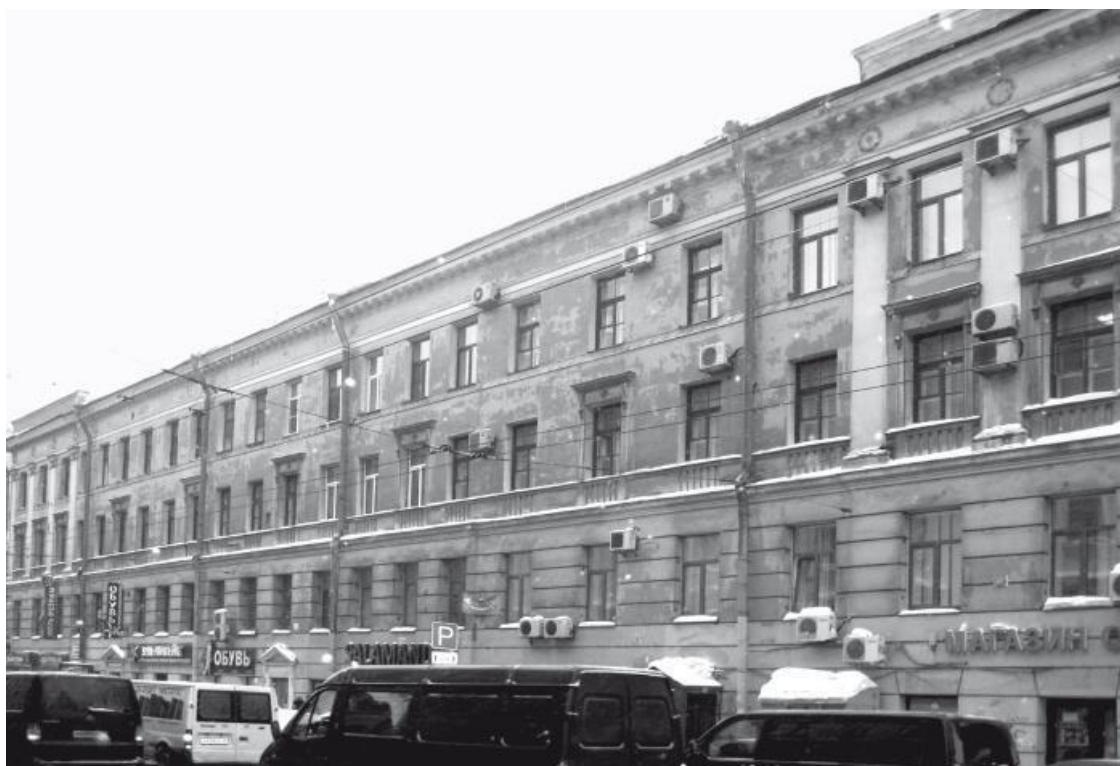
Загородный проспект, д. 5

Домовладение во 2-м участке Московской части по Загородному проспекту по купчей крепости от 16 декабря 1830 г. принадлежало жене генерал-майора Устинье Васильевне Козловой (1808–1897; урожд. Зиновьевой). В Атласе Цылова в 1849 г. здесь значится двухэтажный каменный тридцатиметровый дом вдоль проспекта. Одновременно семье принадлежал участок земли по Троицкому переулку, 35, где вдоль улицы был построен деревянный дом.