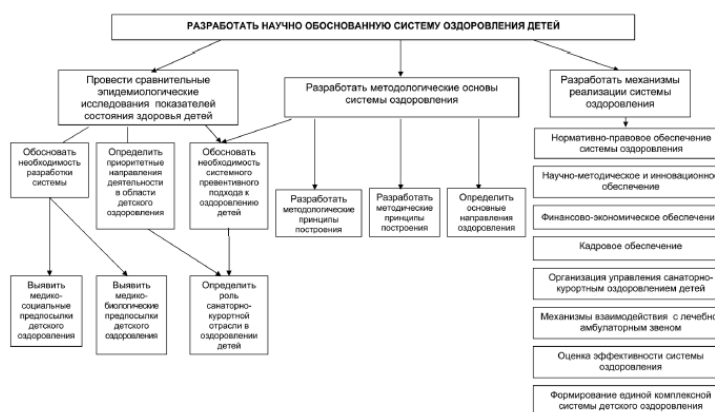
Рис. 2. Дерево взаимосвязей в методике проектирования системы оздоровлен

определение способа структуризации системы. Структурные уровни проектируемой системы выделялись по признаку непрерывного жизненного цикла выполняемых функций. При этом определялись уровни ДВ, соответствующие цепочке: цель – этапы – задачи – мероприятия. В структуру ДВ на каждом уровне включались элементы, последовательно конкретизирующие содержание работ, представленных на более высоком уровне. Таким образом, в использованной методике проектирования системы оздоровления детей задействованы три звена композиционной цепочки дерева взаимосвязей: цель, этапы, задачи (рис. 2).