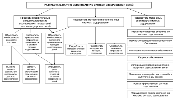
Рис. 2. Дерево взаимосвязей в методике проектирования системы оздоровлен

ке проектирования системы оздоровления детей задействованы три звена композиционной цепочки дерева взаимосвязей: цель, этапы, задачи (рис. 2).