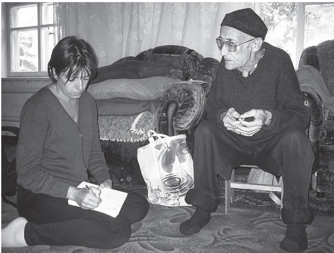
Беседа в ауле Артакишл. Омская обл., Шербакульский р-н. 2009 г.

Это общая для историков, социологов или антропологов ситуация перевода и интерпретации. Во-первых, гуманитарные науки принимают во внимание то адекватное знание, которое содержится в представлениях акторов о своих действиях. Во-вторых, и сами гуманитарные науки являются интерпретирующими дисциплинами. Поэтому очевидно, что наша реконструкция реальности во многом зависит от реакции и представлений наших собеседников. Естественно, мы пытались отслеживать и фиксировать все возможные реакции на то или иное событие или явление, сам процесс интерпретации акторами их действий. Следуя призыву Франсуа Досса, мы принимали всерьез представляемые нам аргументы и не пытались «их принизить или дискредитировать, противопоставляя им свою, якобы более глубокую интерпретацию» (Досс 2013: 15). Таким образом, мы стремились следовать интерпретационной парадигме, которая «выявляет значение интерпретации в структурировании деятельности, используя весь концептуальный ряд, все семантические категории, имеющие отношение к действию: интенции, волю, желания, мотивы, чувства и т. д. ...при этом повышается значение повседневности и самых разнообразных форм социальной жизни» (Досс 2013: 16).