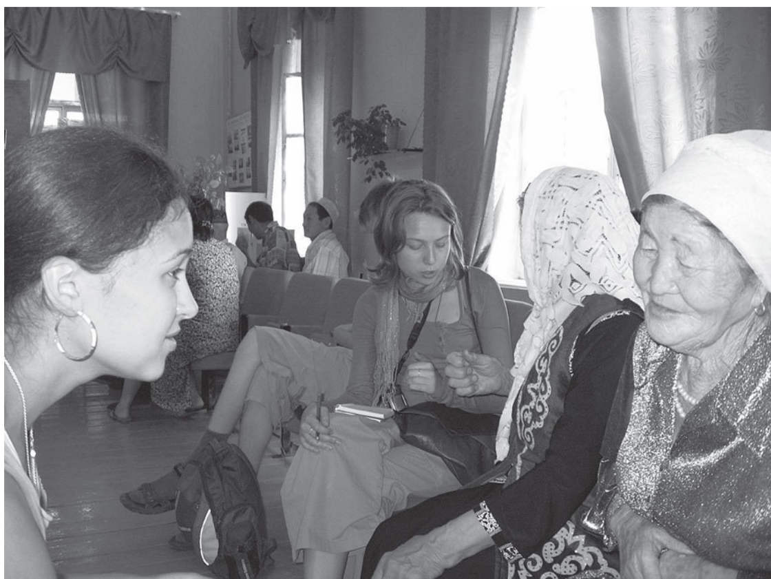
Беседы в клубе. Саратовская обл., Новоузенский р-н, с. Дмитриевка. 2008 г.

Таких случаев в нашей практике было немного, но всякий раз мы испытывали и моральные, и профессиональные муки – невозможно работать с группой людей, специально собранных для нас – не сложится никакая душевная беседа. (Иногда покровительство НКО создавало препятствия и другого рода. Люди, настроенные оппозиционно, критически, старались «держать язык за зубами», предполагая, что мы можем передать информацию руководителям, администрации.)